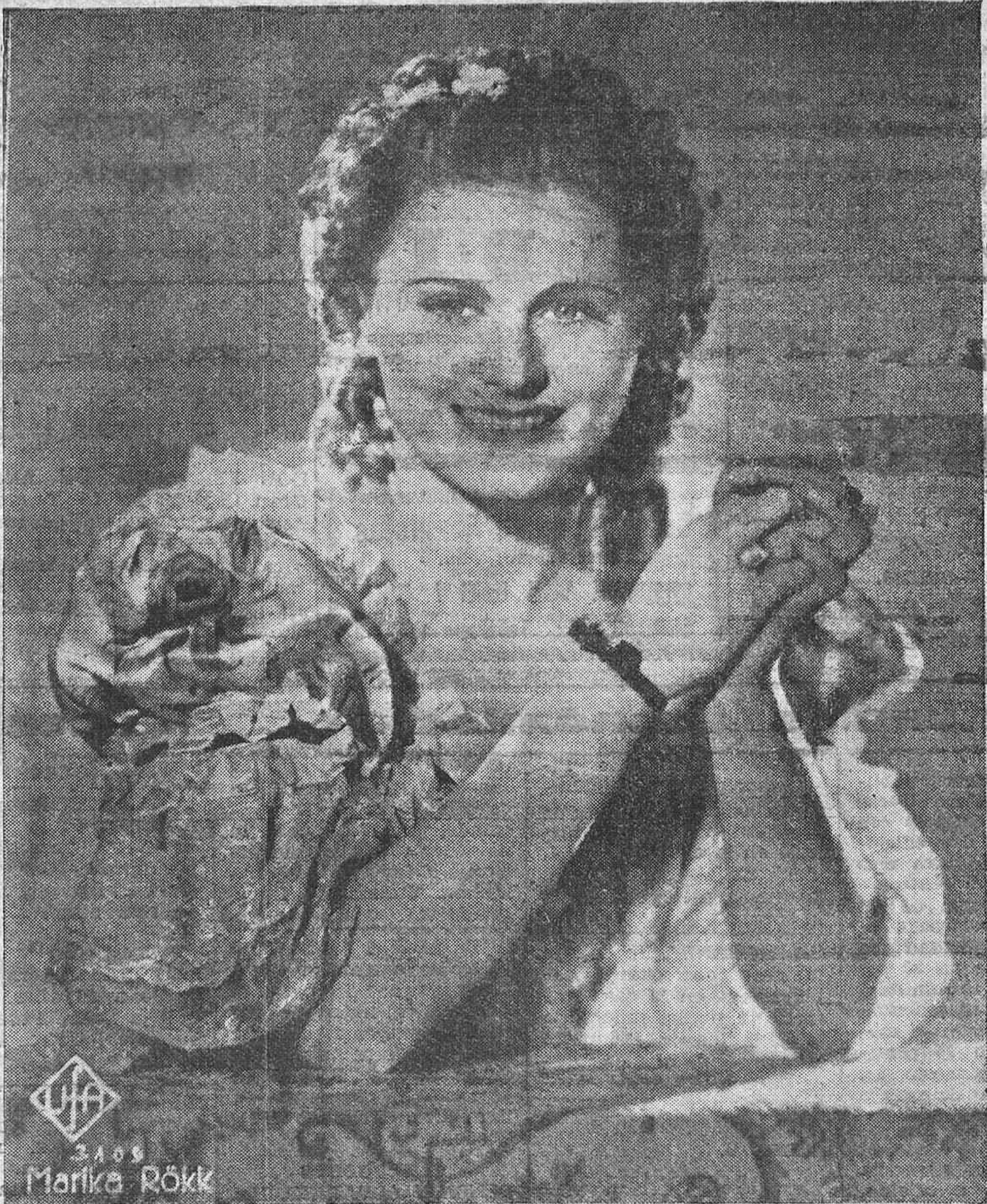
La bella actriz de la "Ufa" Marika Rokk, una de las más afamadas estrellas del cinema europeo. Sus éxitos en la pantalla han sido resonantes, y es considerada como una de las primeras figuras de los Estudios de Berlín.