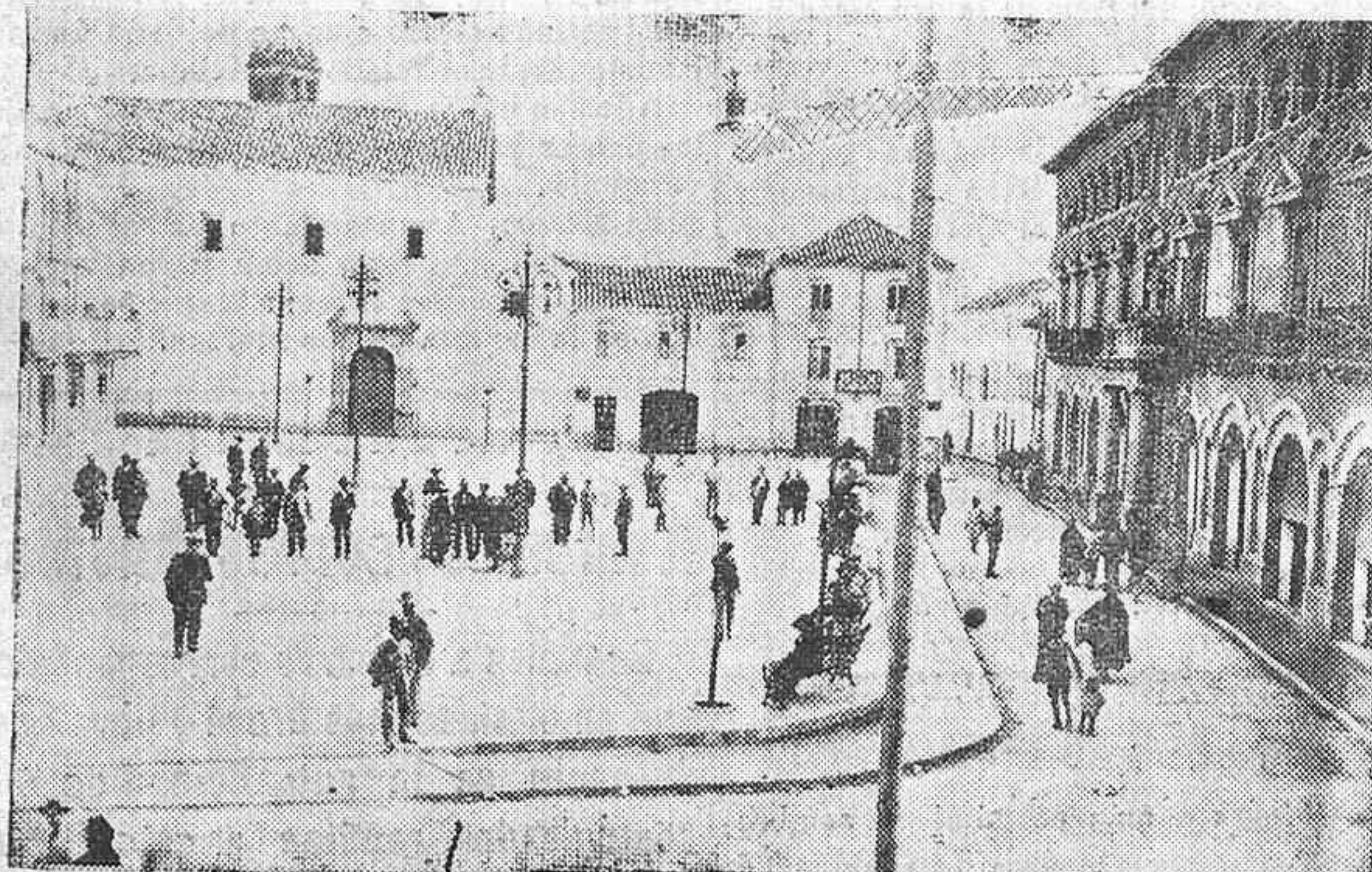
MONTILLA.—PLAZA DE ALFONSO XII, RECIENTEMENTE RECONSTRUIDA.

EN GRANADA: Kiosco «La Prensa», Puerta Real.—Acera del Casino, 23.