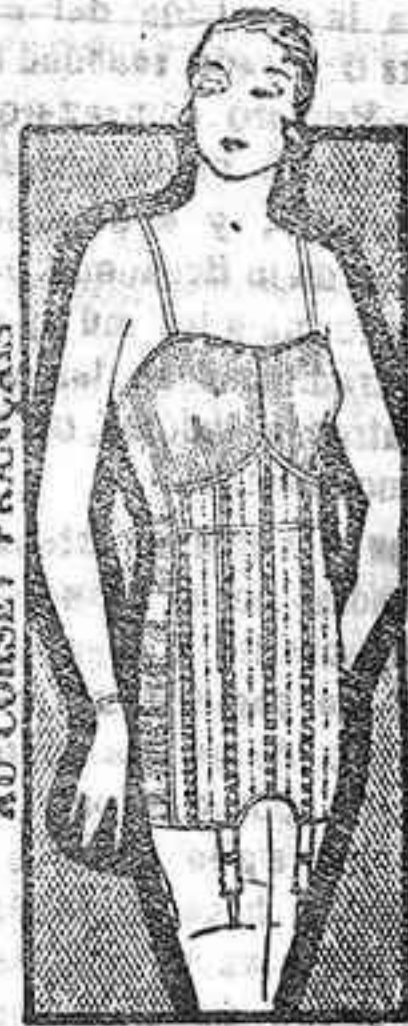
AD. CORSET FRANCÉS

Este periódico se publica con carácter sesantenario