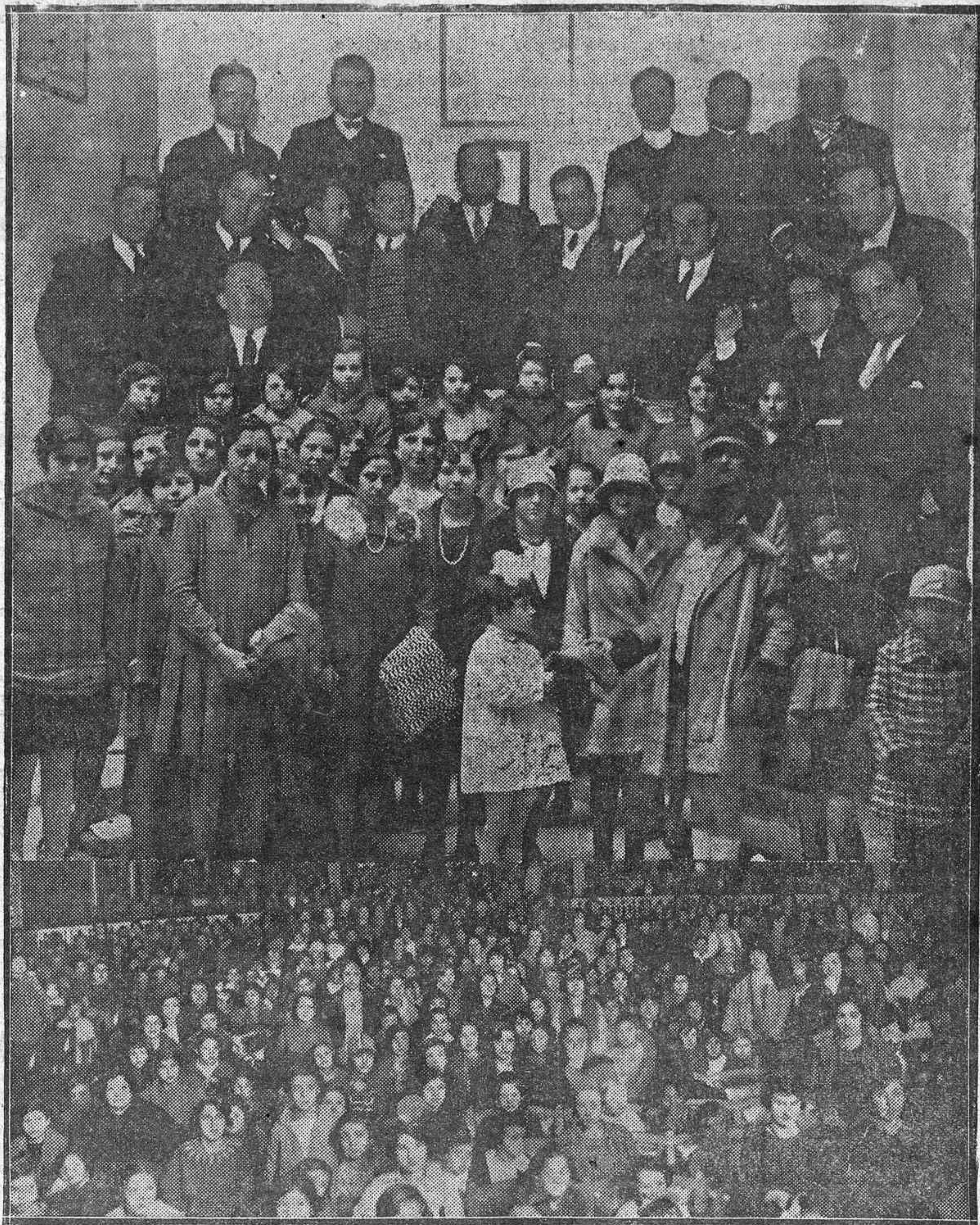
Nuevo Club Taurino: buenos aficionados que acaban de constituir la Peña Barrera.— Preciosas niñas del Coro de la Acción Católica de la Mujer repartiendo prendas de abrigo a las obreras de sus clases.— Aspecto del Teatro Duque de Rivas durante el festival dado por el señor Cabrera en honor de las niñas de Córdoba.