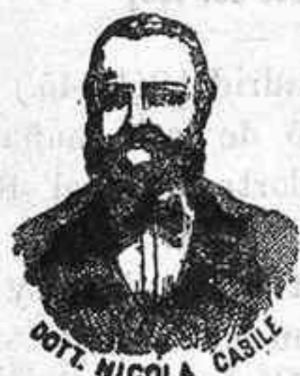
Inventor de los renombrados medicamentos

Esta casa no tiene sucursal y es la única en Córdoba que puede vender música de los fondos editoriales de Romero, Zozaya, Pablo Martín, Fuentes y Asanjo, Eslava, Almagro y Compañía y E. Marzo, que componen hoy la tan importante Sociedad Anónima casa DOTESIO. Se facilitan catálogos de música y Gramófonos, nota de precios de pianos al contado y á plazos y cuantos datos soliciten.