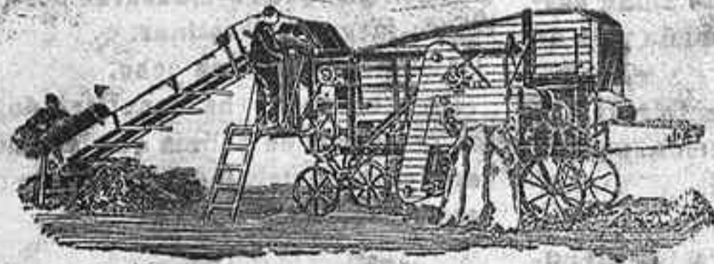
Trilladora Triunfo chica