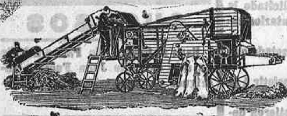
Trilladora Triunfo chica

Para labores grandes: Trilladoras Lanz de 4½ y 5 pies de ancho con locomóviles de igual marca. Rendimiento diario de 42 a 46 y de 50 a 55 carretadas.