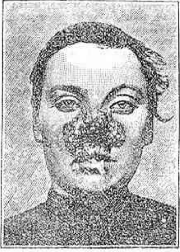
Ante de la curación