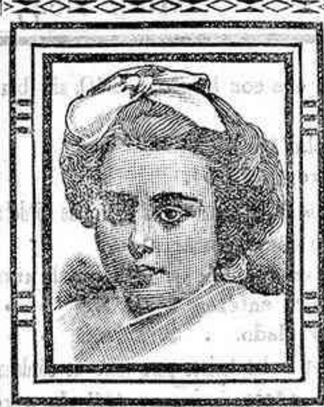
Barcelona, 11 Febrero 1908.

Se ignoran los móviles de tan reprochable resolución.