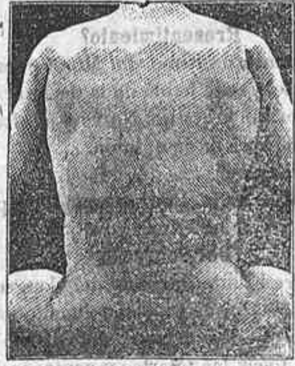
Después de 15 días de tratamiento