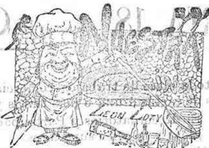
Comidas para el 28 de Diciembre