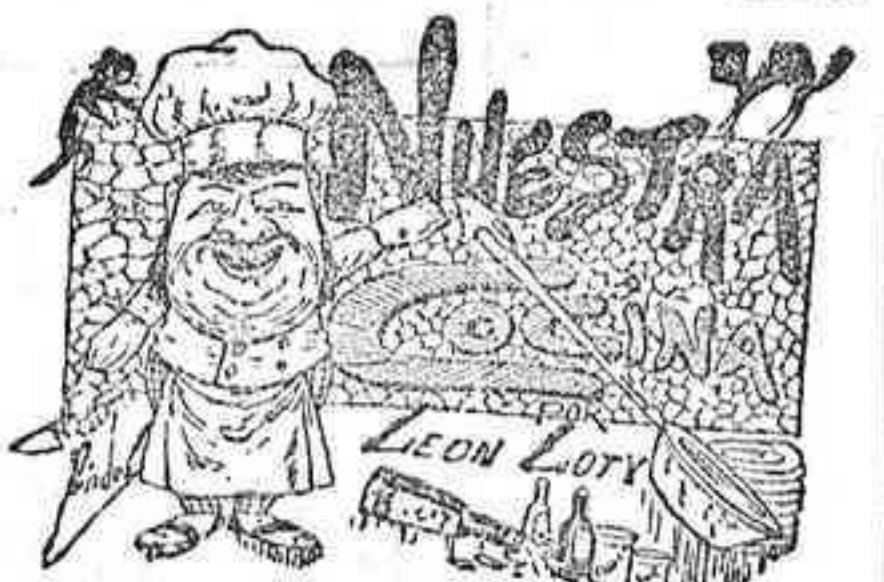
Comidas para el 2 de Mayo

—En la iglesia del colegio de nuestra Señora de la Piedad, se hace el ejercicio de las flores de Mayo, un cuarto de hora después de la oración, con cánticos. Los domingos y días festivos habrá pláticas.