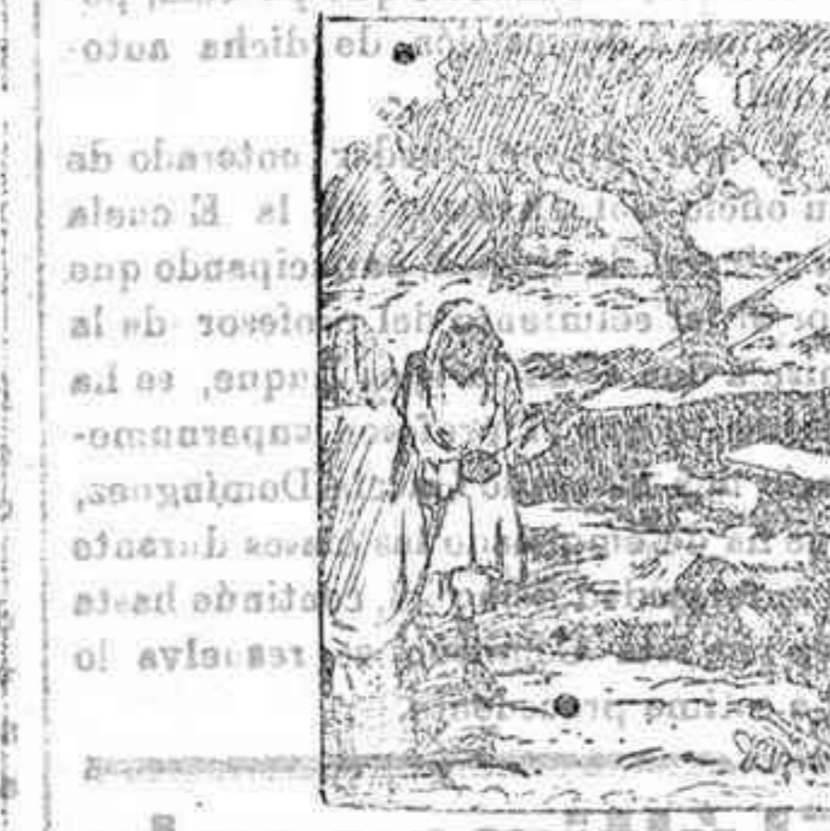
(Extrañando osamentas humanas de la cisterna)

Santa Perpetua fué devorada por las fieras en unión de otros cristianos compañeros el 7 de Marzo del año 203 y Santa Felicidad sufrió igual martirio y en el mismo punto tres años más tarde. La descubierta basílica debió ser destruida probablemente cuando la invasión de los vándalos. El padre Dellatre ha procurado reconstituir lo que fué aquel templo examinando cuidadosamente las pilas de esculpidas, los mosaicos y los diversos ornamentos que van apareciendo. La nave esferida estaba cubierta por una terraza que reco-