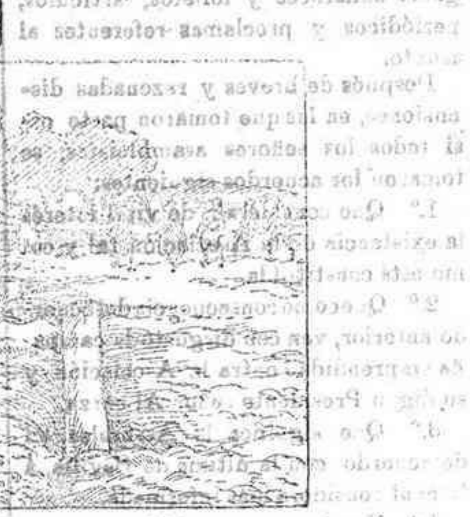
(Vista del terreno donde aparece la basílica)

En el centro de una de las naves se observa una pequeña capilla donde ya se han enterrado los cuerpos de Santa Perpetua y Santa Felicidad, tan buscados por los historiadores del Martirologio romano. La tal capilla se fundó en las Arenas de Cartago, bajo el reinado de Alejandro Severo.