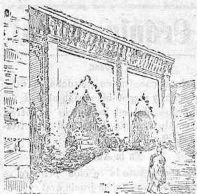
Ruinas de una antigua fuente

El culto al agua, más exaltado por los pueblos sedientos, que por todos los que disponen de grandes venas de riego, tiene en Marruecos suficientes motivos de su existencia en incomparables y magníficos monumentos.