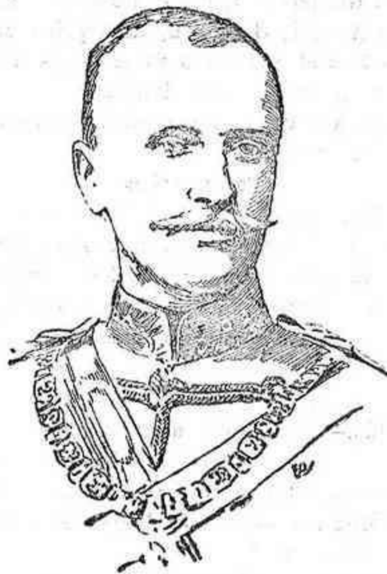
Rey de Sajonia

Nació en Dresde 25 de Mayo de 1865. Es hijo del rey Jorge y de la reina Maria Ana, infanta de Portugal, y por consiguiente, primo del rey don Carlos. Ocupa el trono desde el 15 de Octubre de 1904.