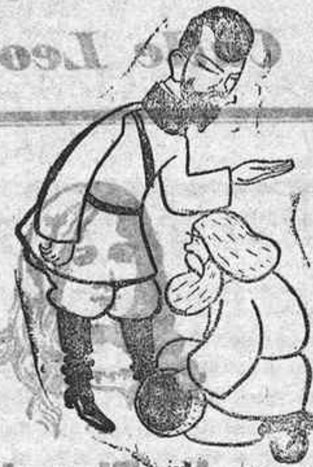
La del tsar de Rusia