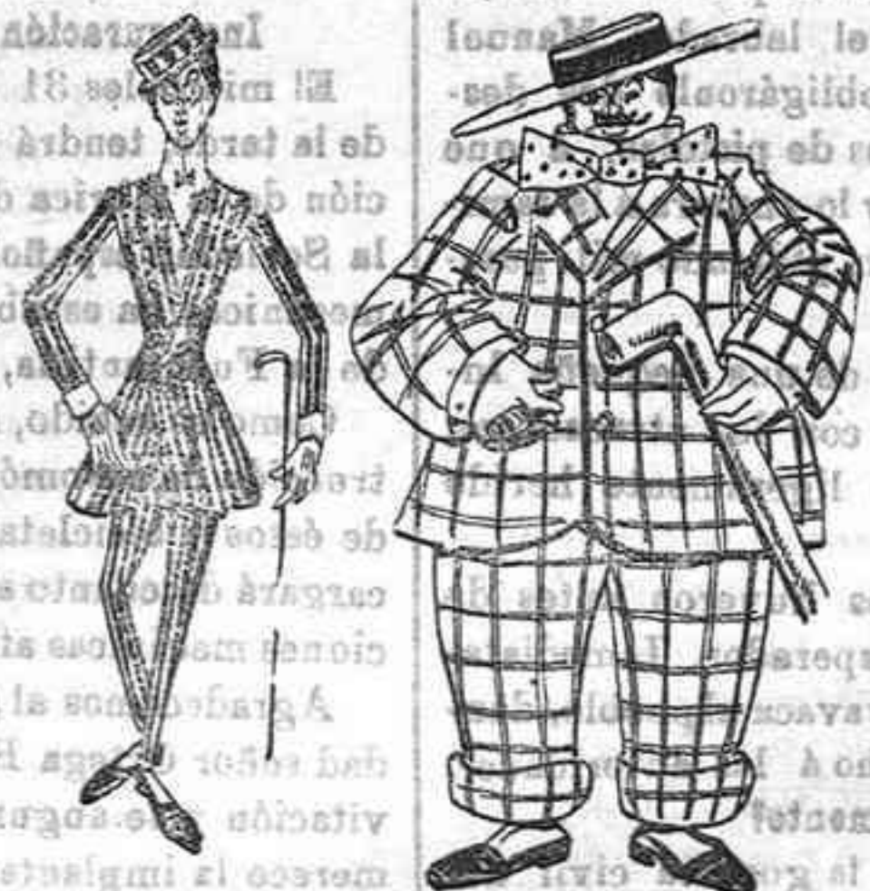
El que gustó en la última temporada.