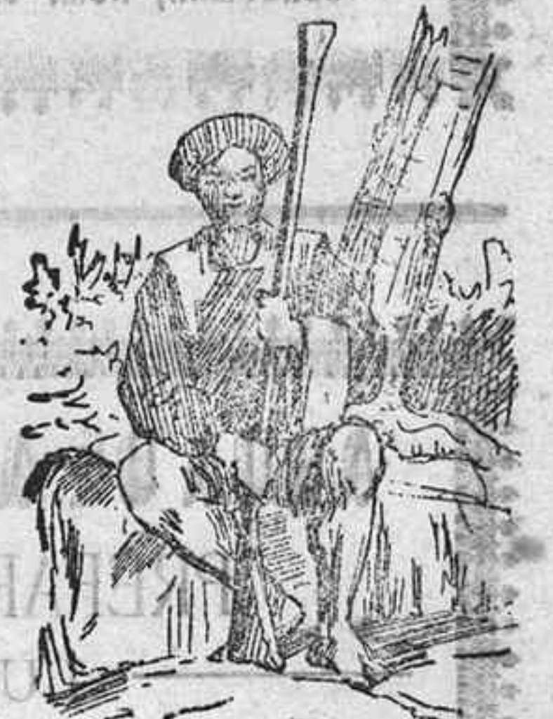
Un guerrero japonés