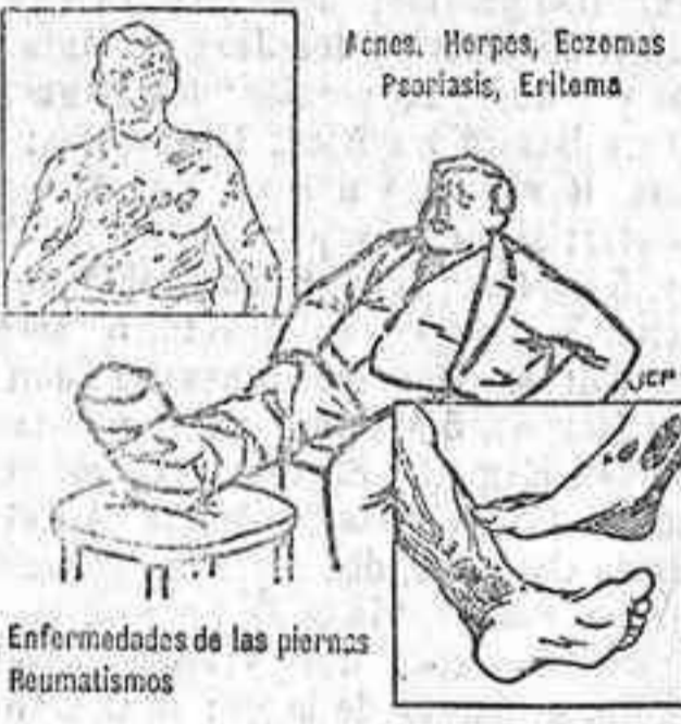
Enfermedades de las piernas Reumatismos