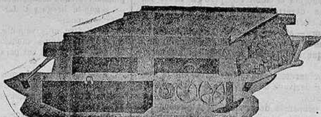
TRILLO ROTATIVO DE GRAN TRABAJO para una sola yunta de mulos.