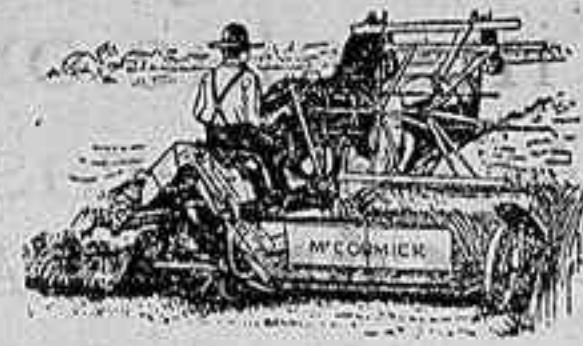
Aladoras Macormick — ULTIMA PERFECCION —