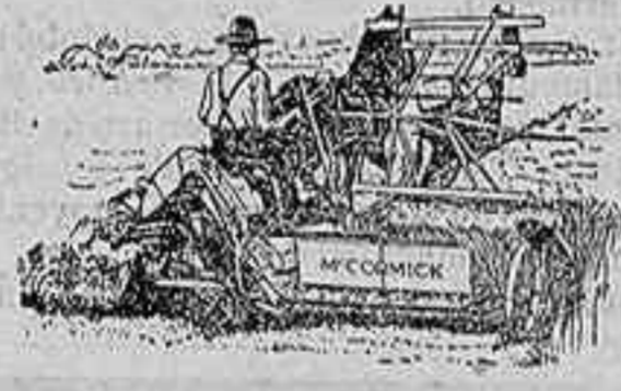
Atadoras Macormick — ULTIMA PERFECCION —