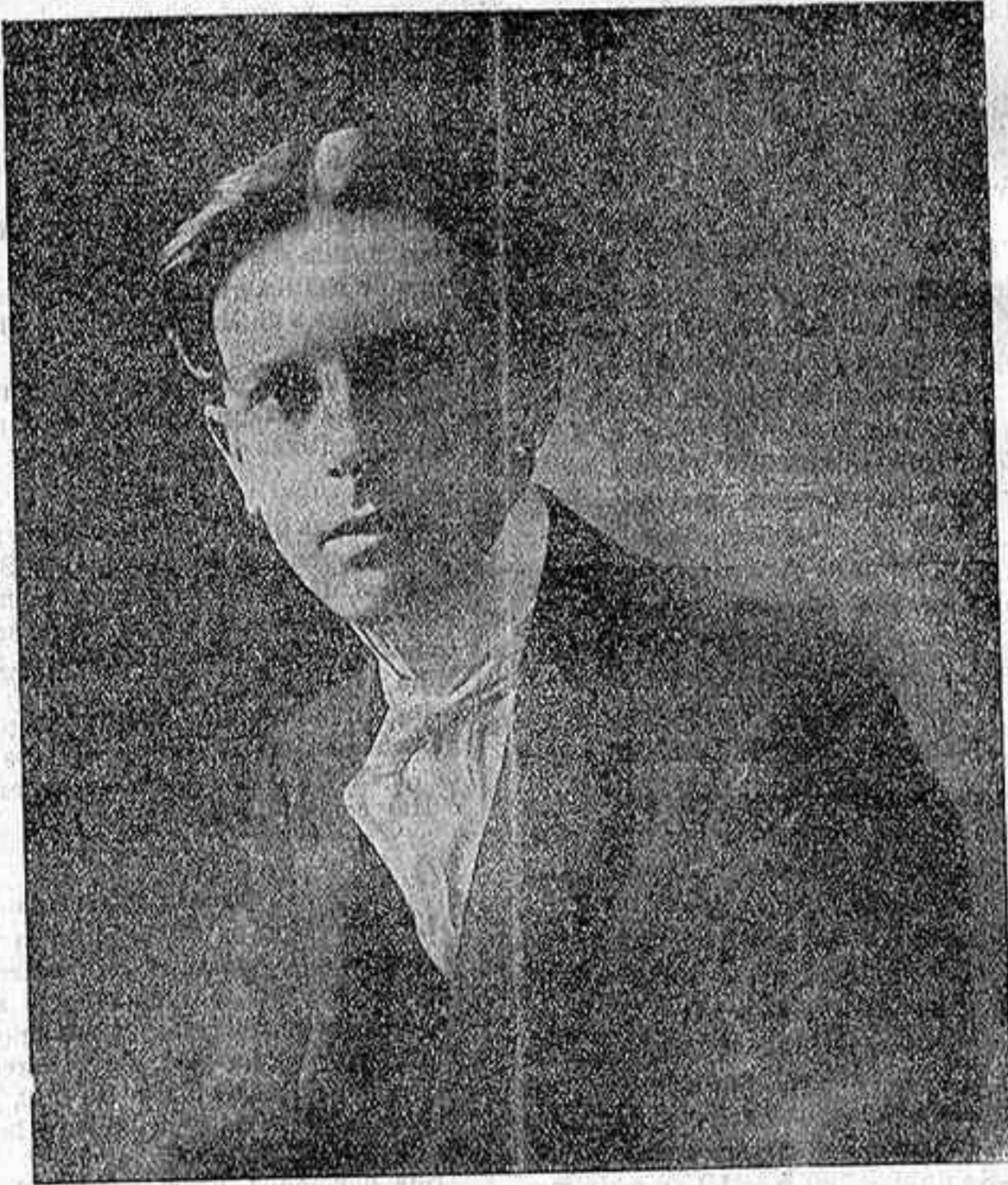
El poeta de Fuente Genil don Agustín Aguilar y Tejera