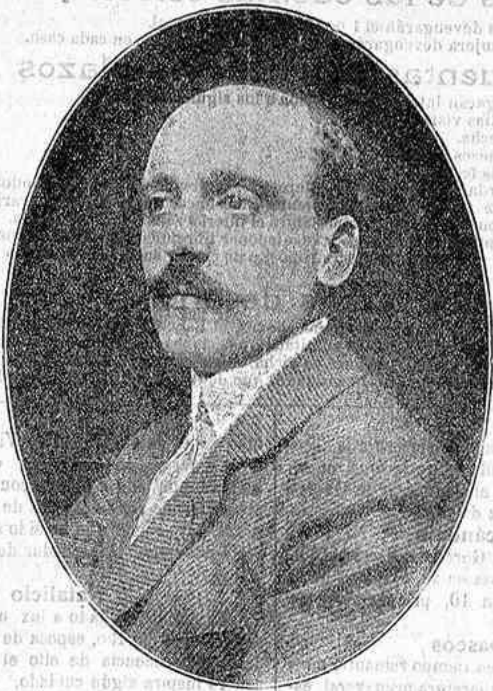
El poeta D. Benigno Iñiguez.