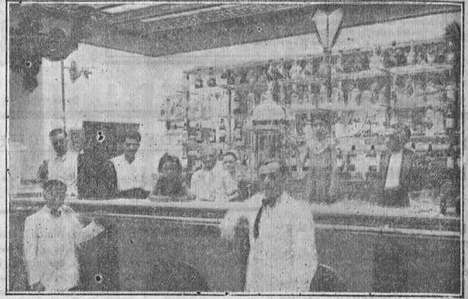
Un aspecto de la muy singular Cerveceria de Cabra «La Cruz del Campo»