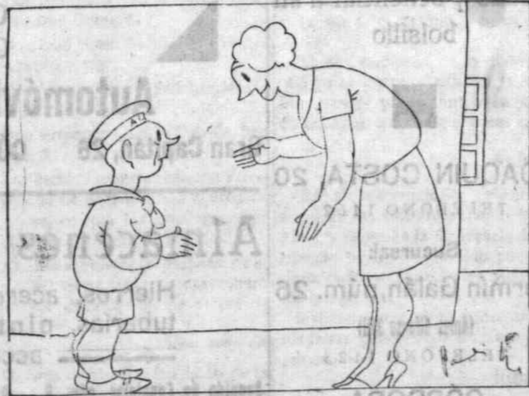
—¿Qué te dijo Fernando cuando le participaste que hoy cumplía yo veinticinco años? —¡Que ya iba siendo hora!