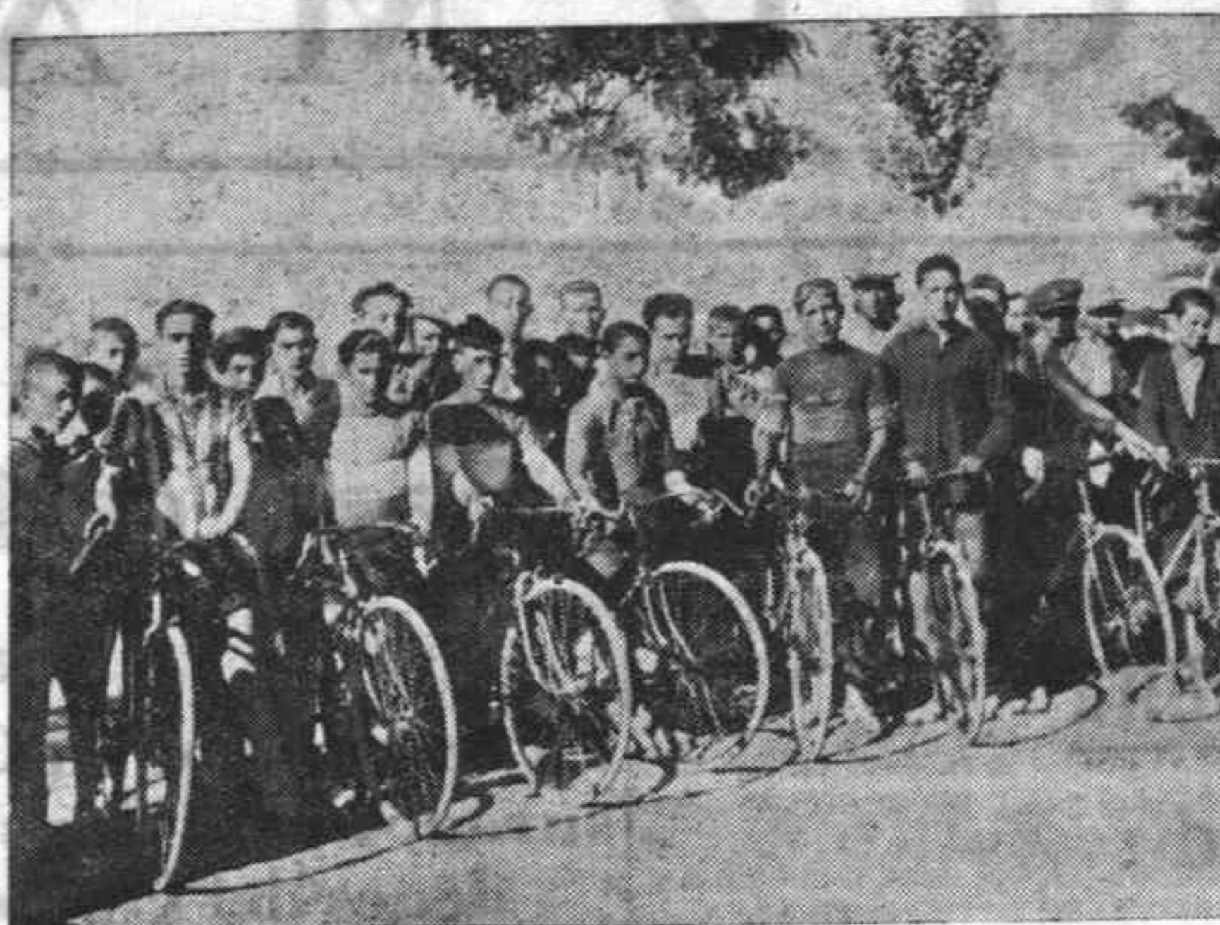
Organizada por el Club Ciclista Cordobés se celebró la primera carrera infantil de bicicletas, que resultó de verdadero éxito. En la foto aparecen los corredores preparados para la salida en el Paseo de la Ribera.