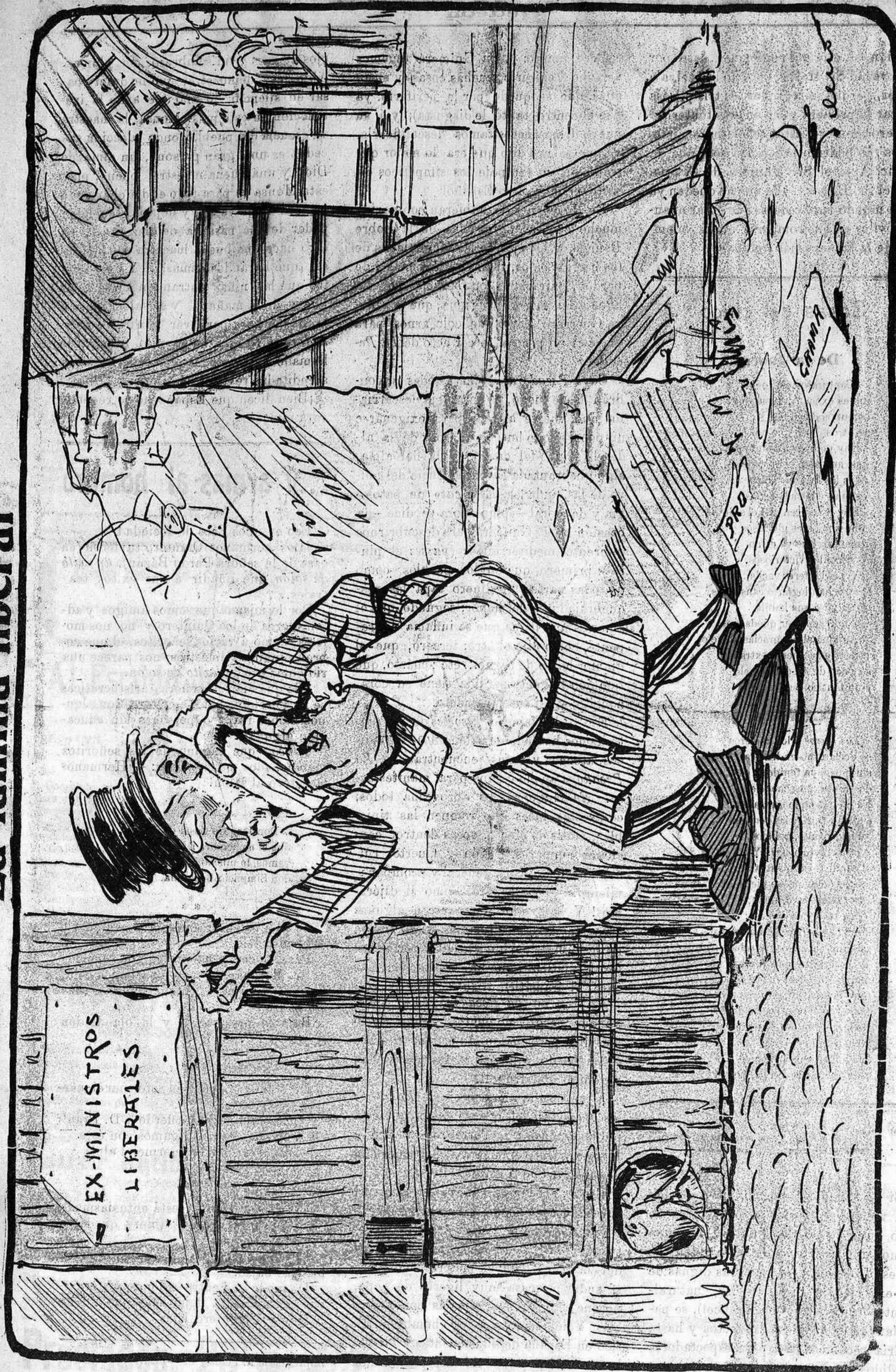
EL PADRE PRÓDIGO