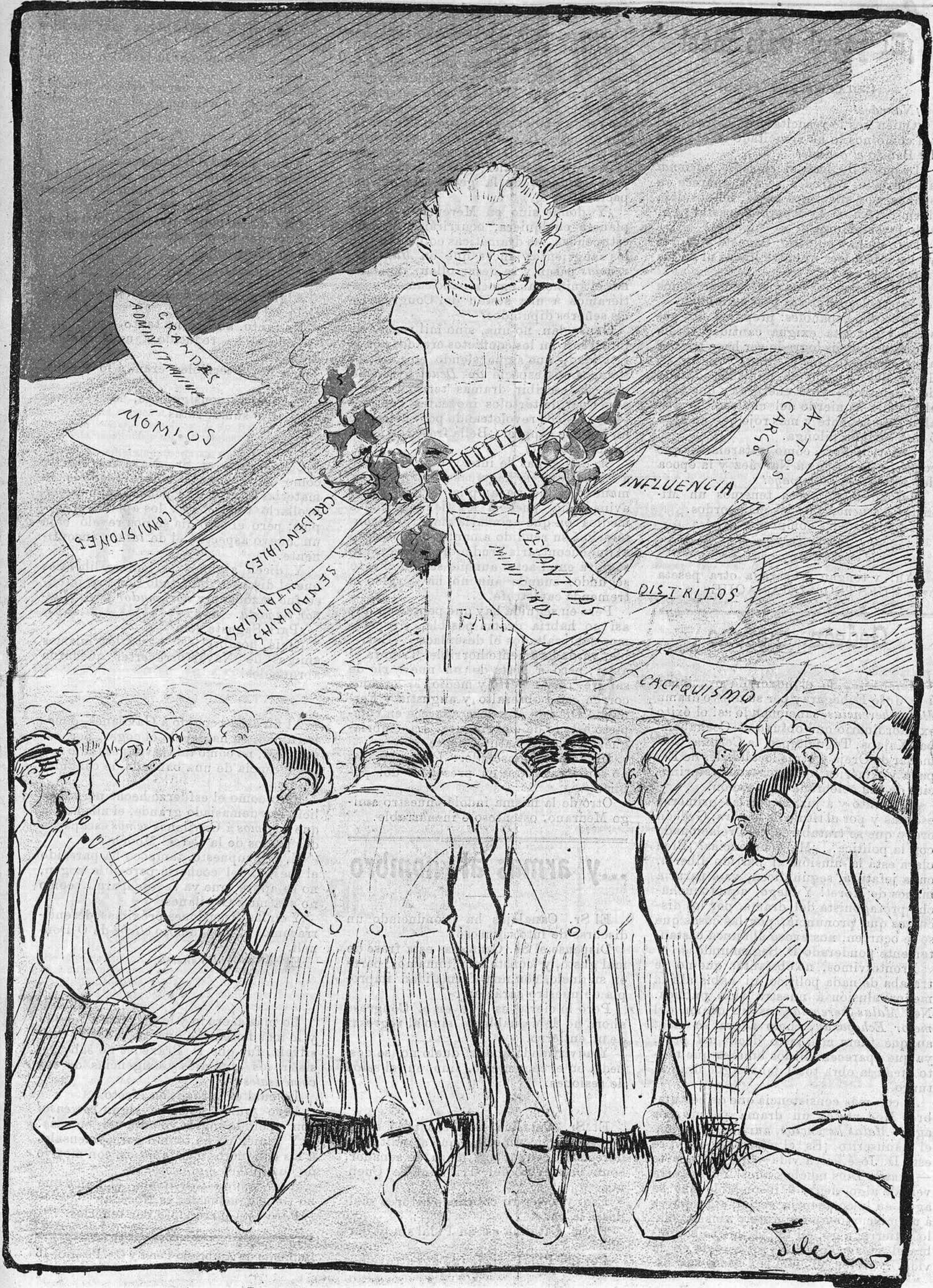
La confianza incondicional de la mayoría al dios Pan.