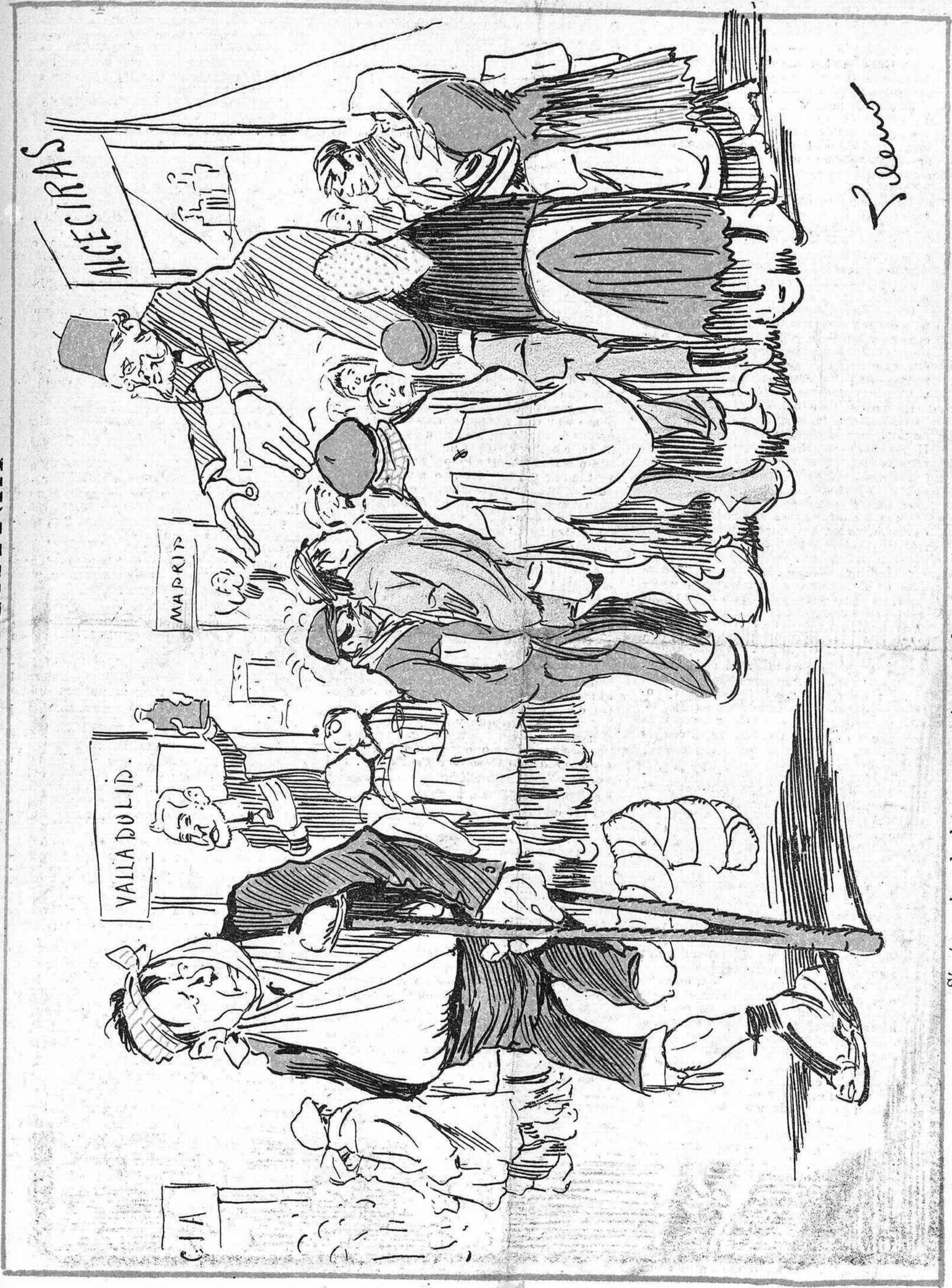
--Sí, sí, muchos charlatanes, pero ni un solo doctor que ponga remedio á mis males.