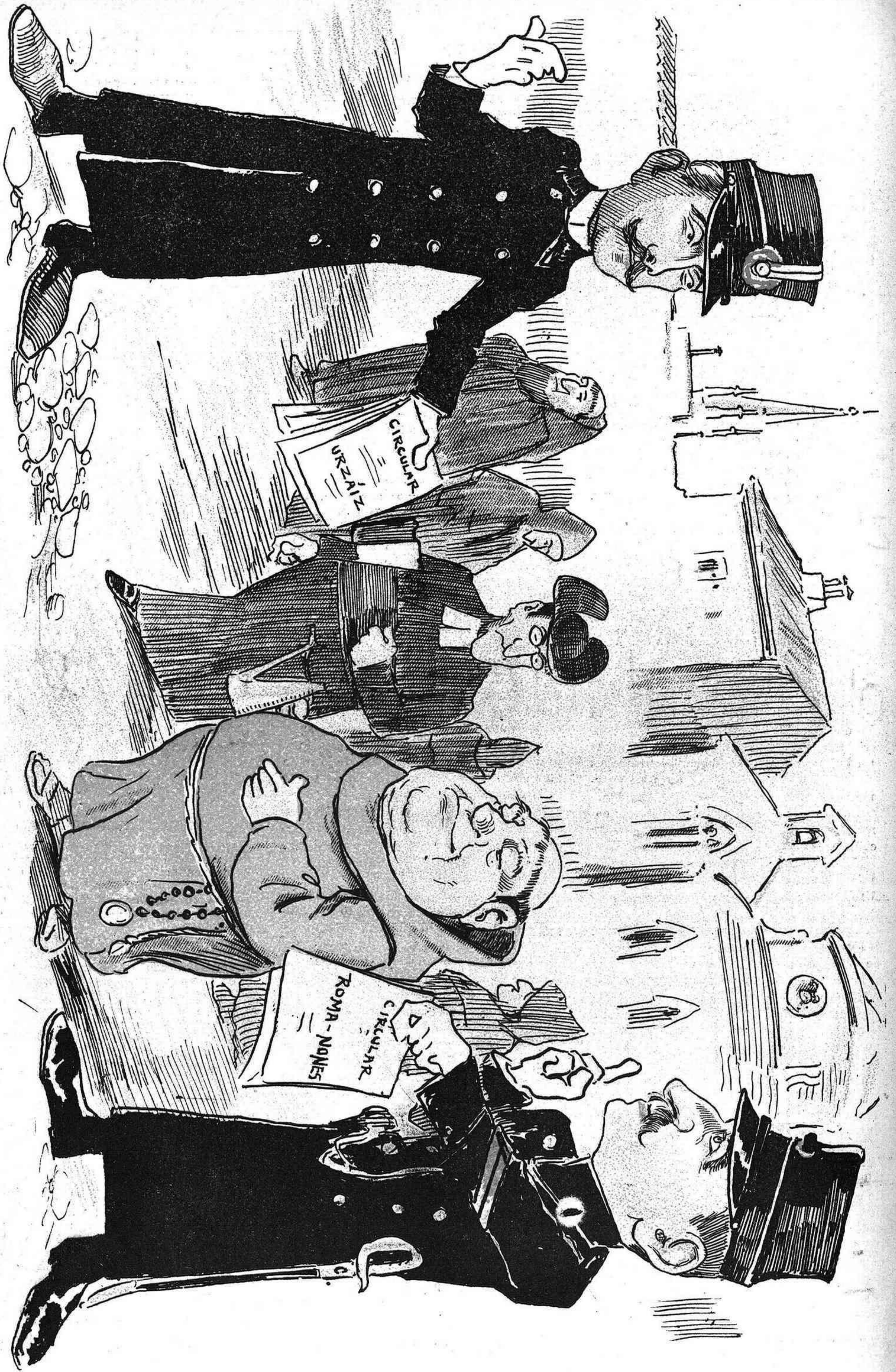
LOS GUARDIAS.—Circular, señores frailes. circular.