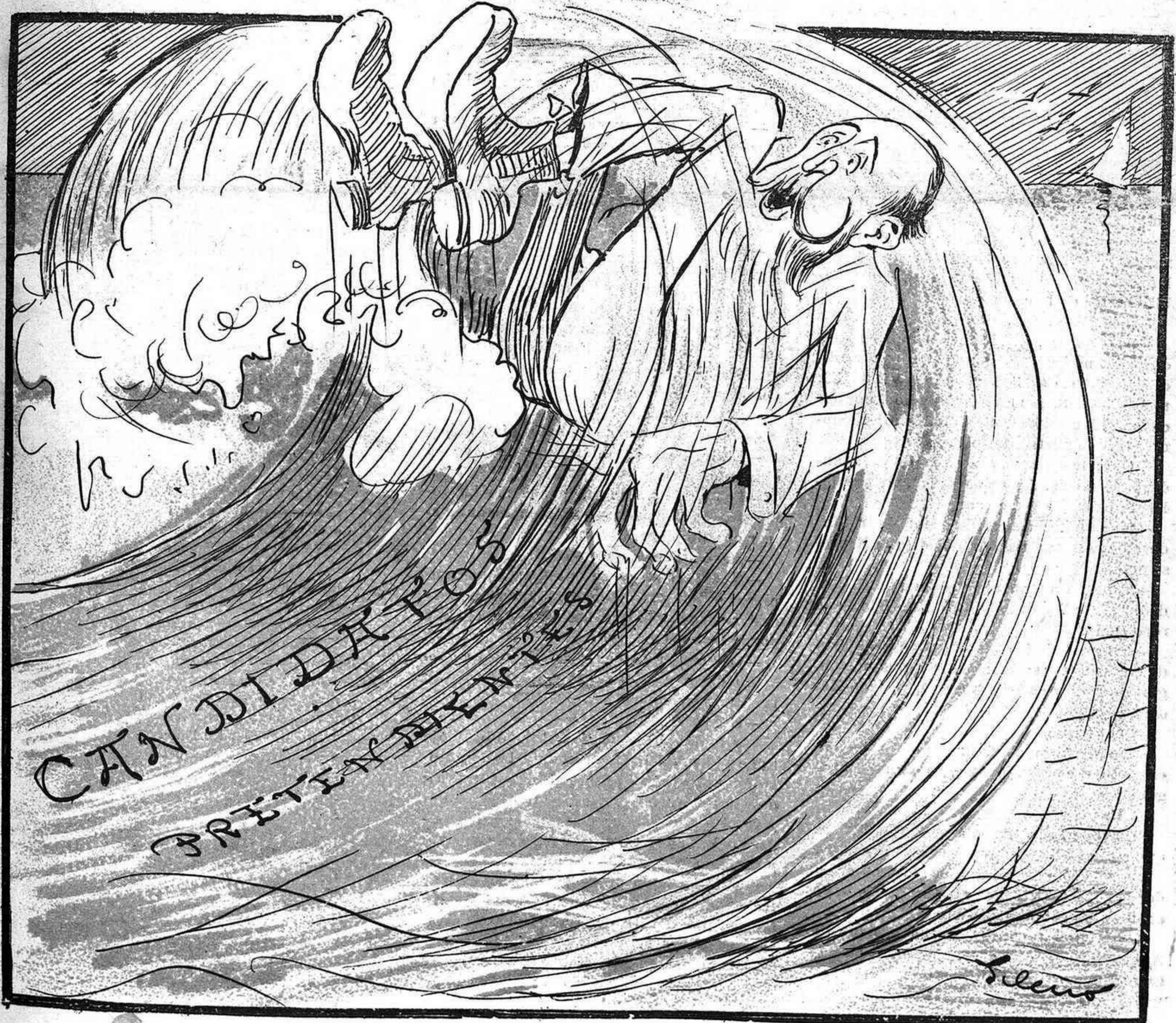
La ola de Don Segis