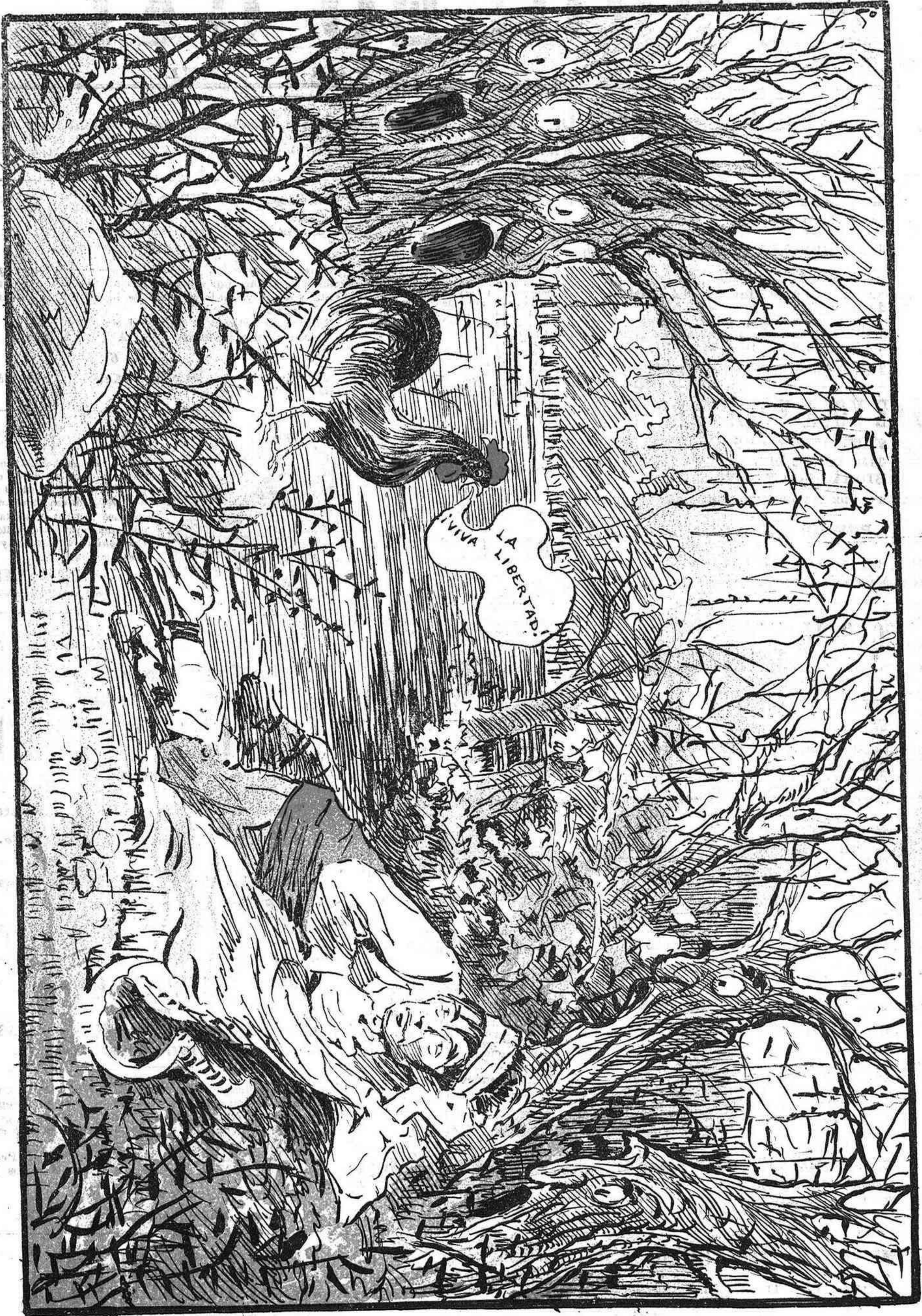
Los murmullos de la selva.