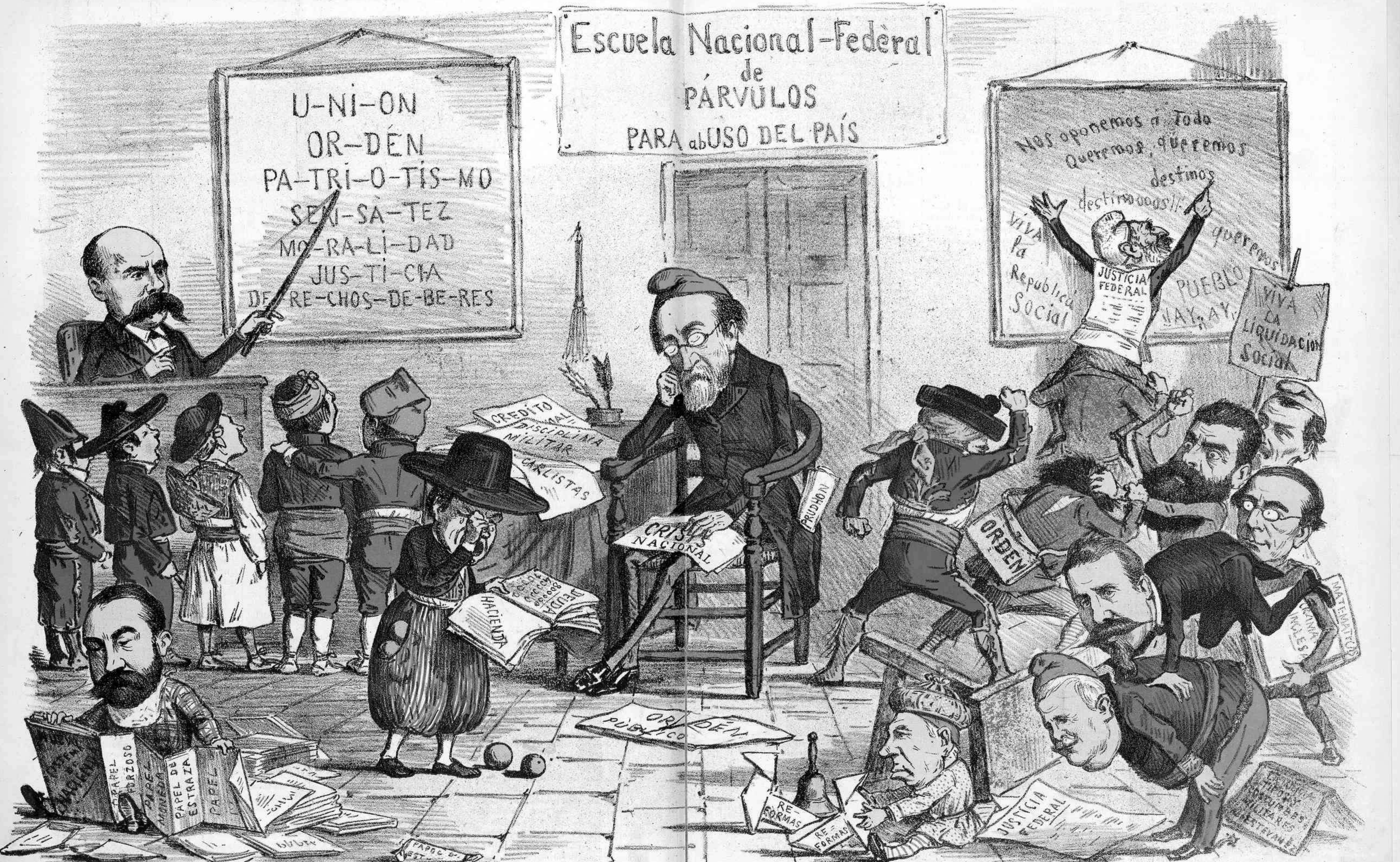
¡SEÑOR MAESTRO, OJO CON ESOS NENES!

Nos oponemos a Todo Queremos, queremos destinos destinooooos!! VIVA la Republica Social JUSTICIA FEDERAL PUEBLO HAY, AY, VIVA LA LIQUIDACION SOCIAL