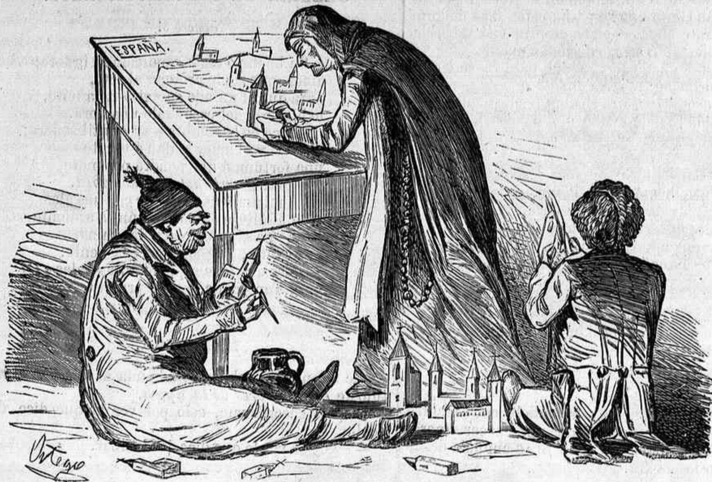
Una monja que trata de hacer la felicidad de España llenándola de conventos.

—Hermana ¿llevais ya muchos? —No padre; solo he puesto uno en Aranjuez, otro en el Escorial, otro en la Granja. —Pues sigamos nuestra tarea, y todo sea por amor de Dios. —Amen.