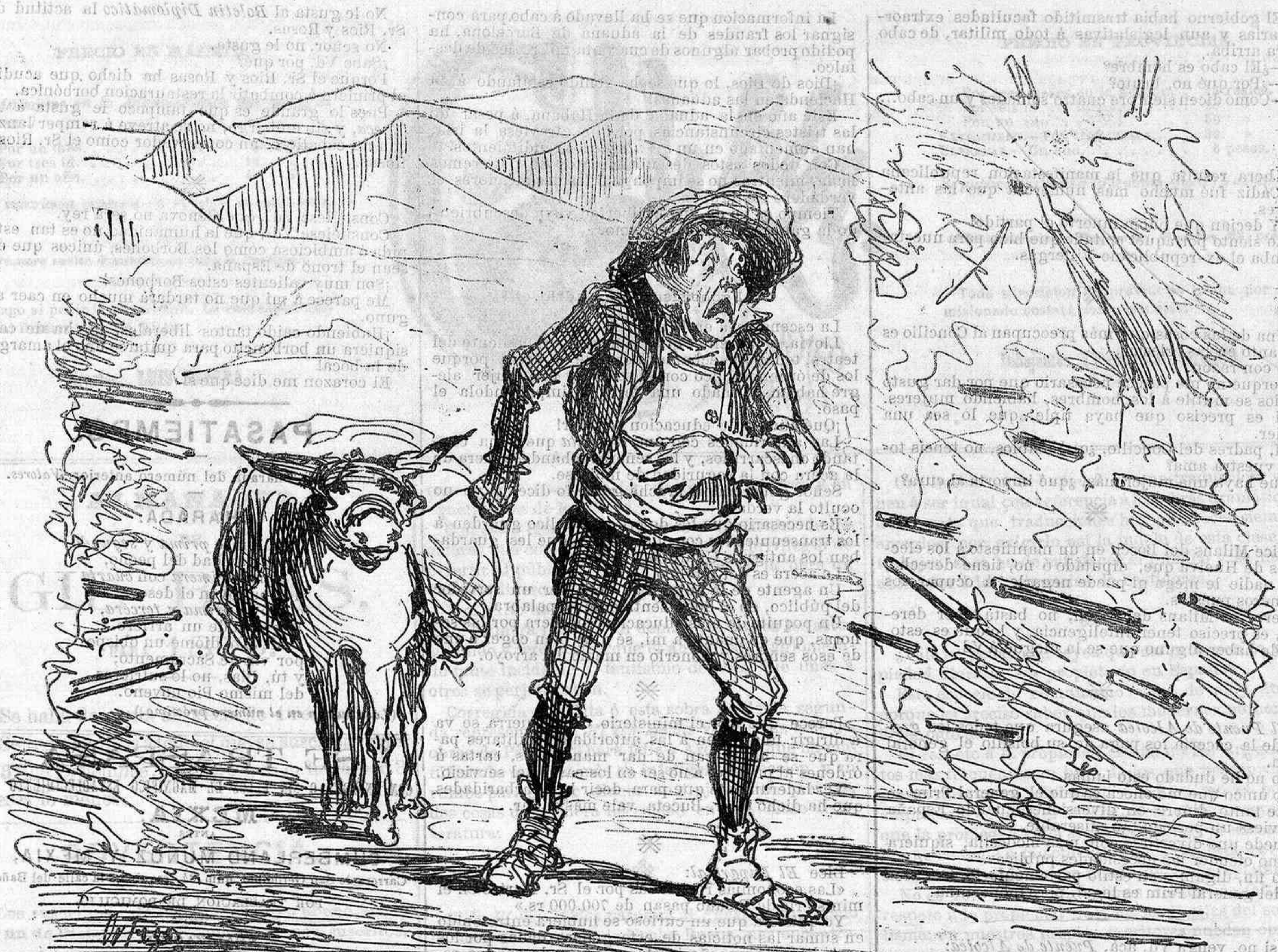
Asombro de las gentes sencillas al ver tanta boca de fuego en los montes de Toledo.

tronamientos, deben tener unos régios ratos de soberano mal humor augustamente terribles.