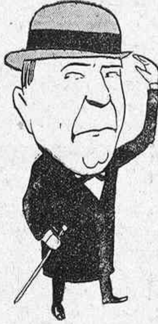
Y saben saludar; p. e.: saluda al presidente de la junta de la cual él es vocal..