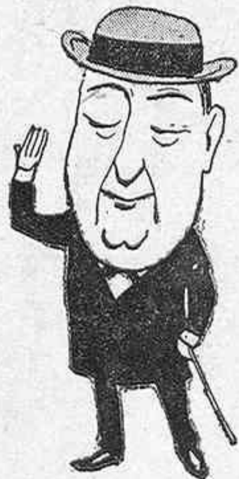
▲ sus empleados: ¡Adios señores!..