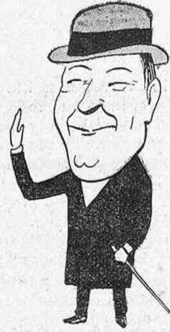
A un sobrino y heredero y á sus protegidos.