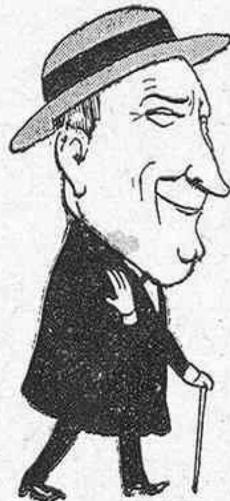
(A una... amiga)