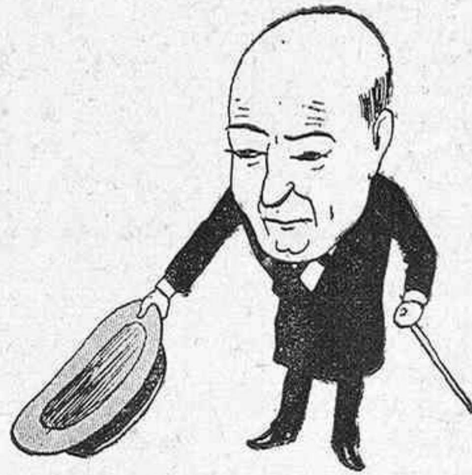
Al jefe del negociado Z. ..... ¡Siempre es bueno conservar ciertas relaciones!