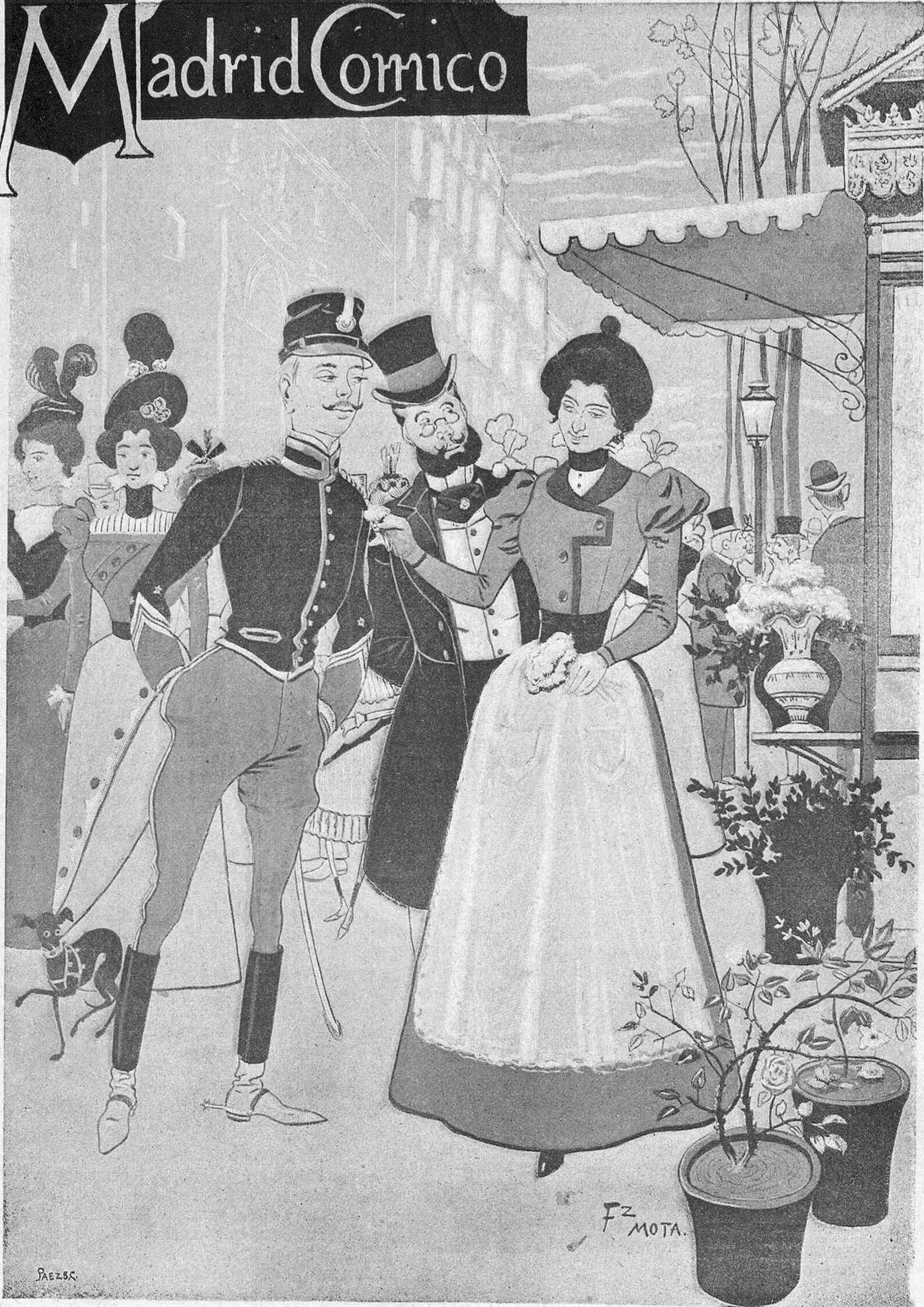
PRIMAVERALES, por Fernández Mota