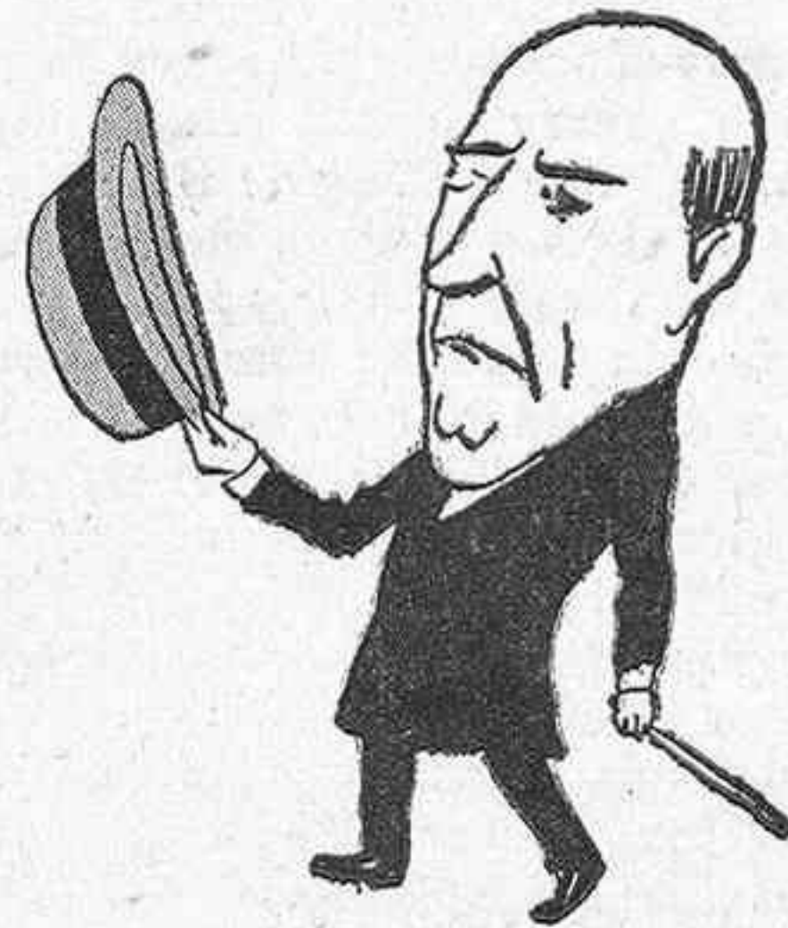
▲ los socios del Ateneo cuando tiene que dar una conferencia.