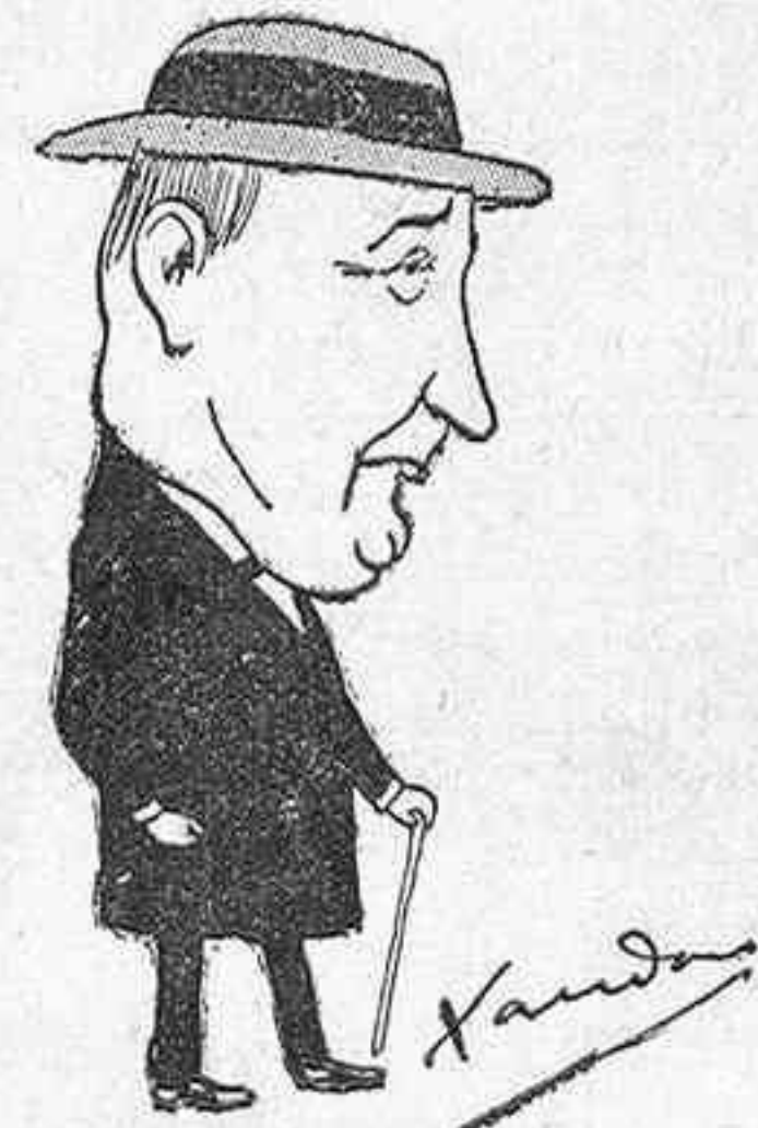
El sabe dar á cada uno lo suyo.