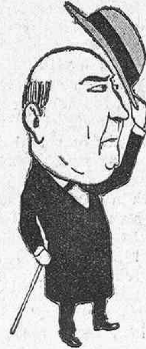
Al casero, sastre, y demás víctimas del deber.