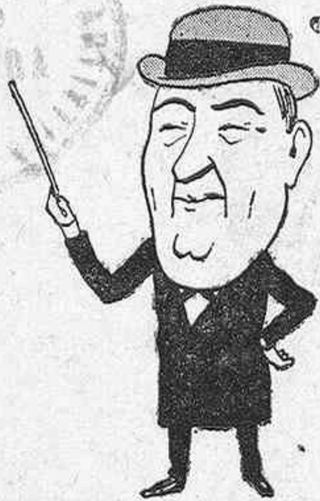
Al profesor de esgrima...