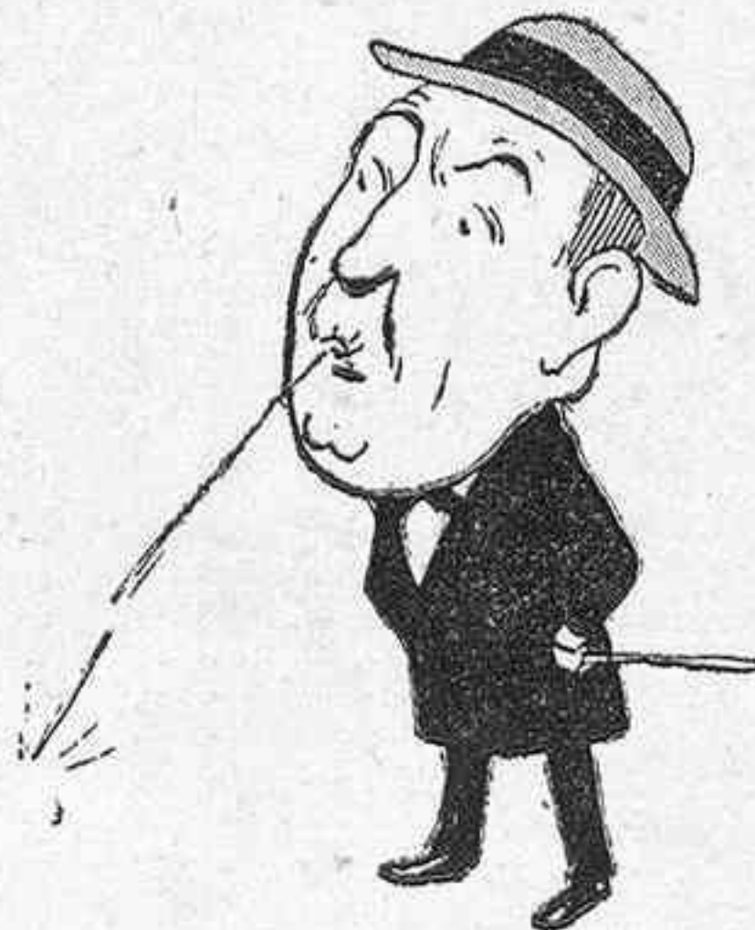
A un señor que le ha hecho una charranada!