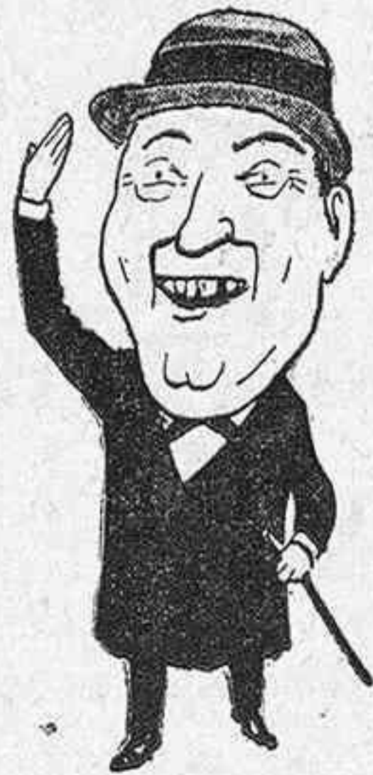
A un compañero de calaveradas.. ¡Adios tú!