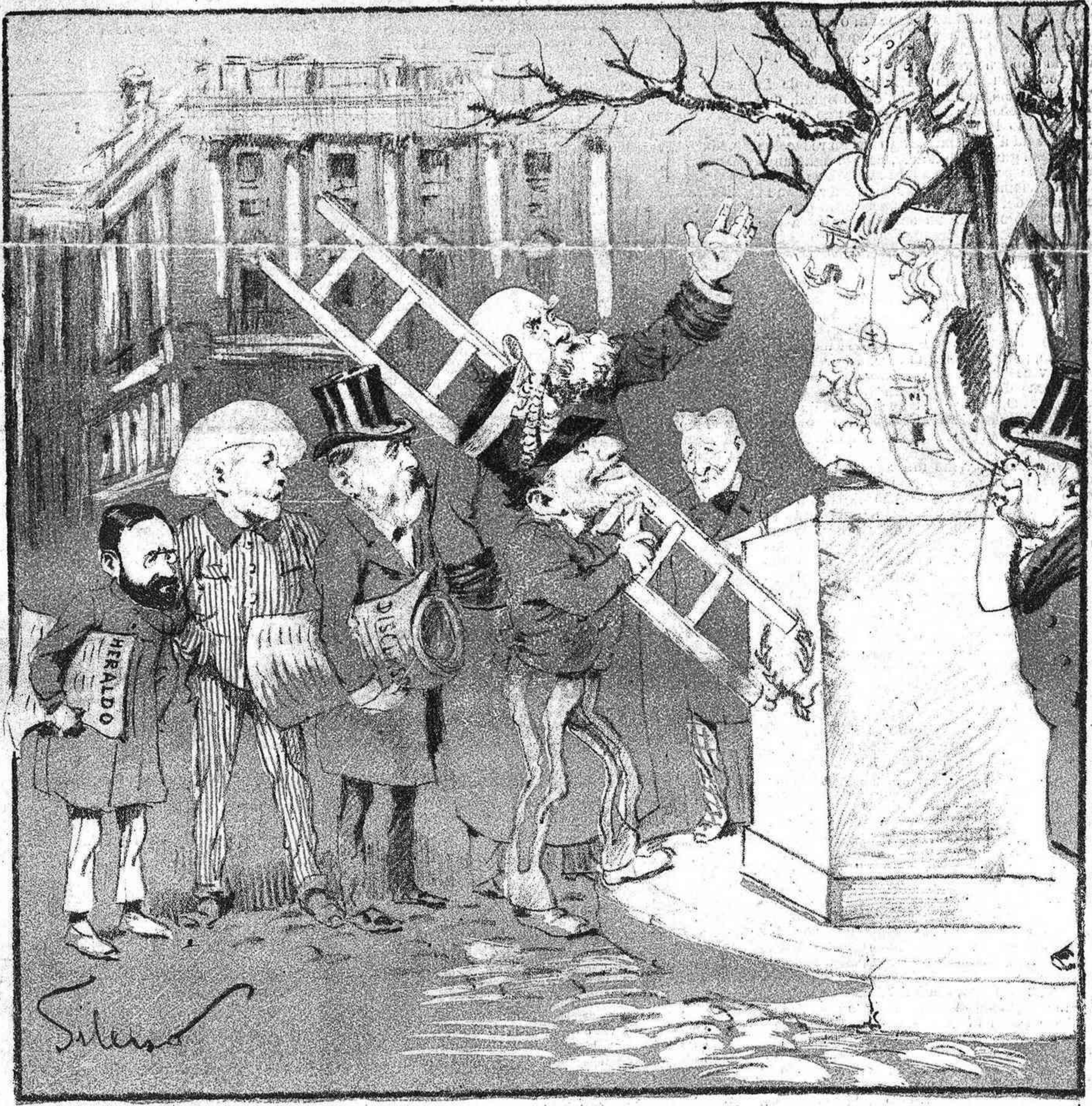
EL ÚNICO GRUPO QUE HA SALIDO ESTE AÑO