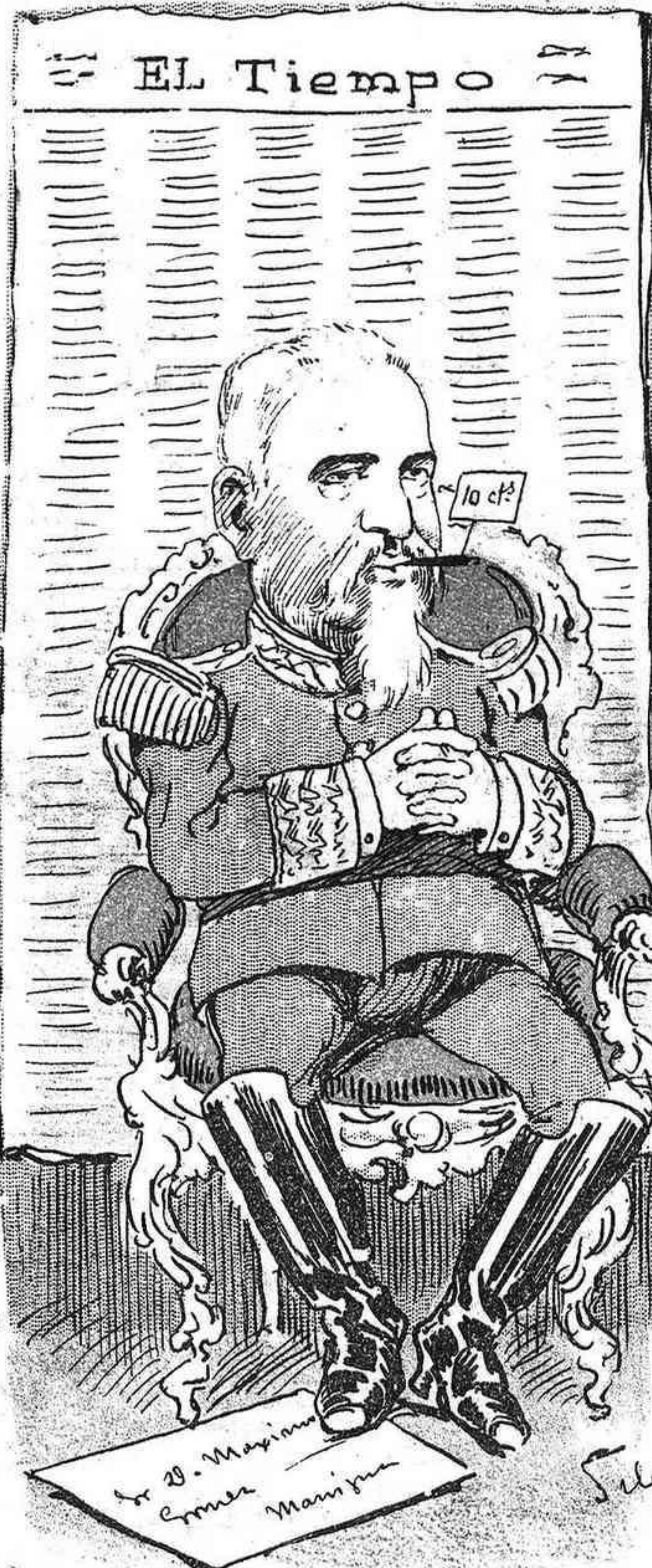
Todo es cuestión de Tiempo.

A Cerralbo, Mella, Sanz, etc.—No les han traído nada los Reyes por ambiciosos, es decir, por haber querido adelantar la Epifanía con su viaje á Venecia.