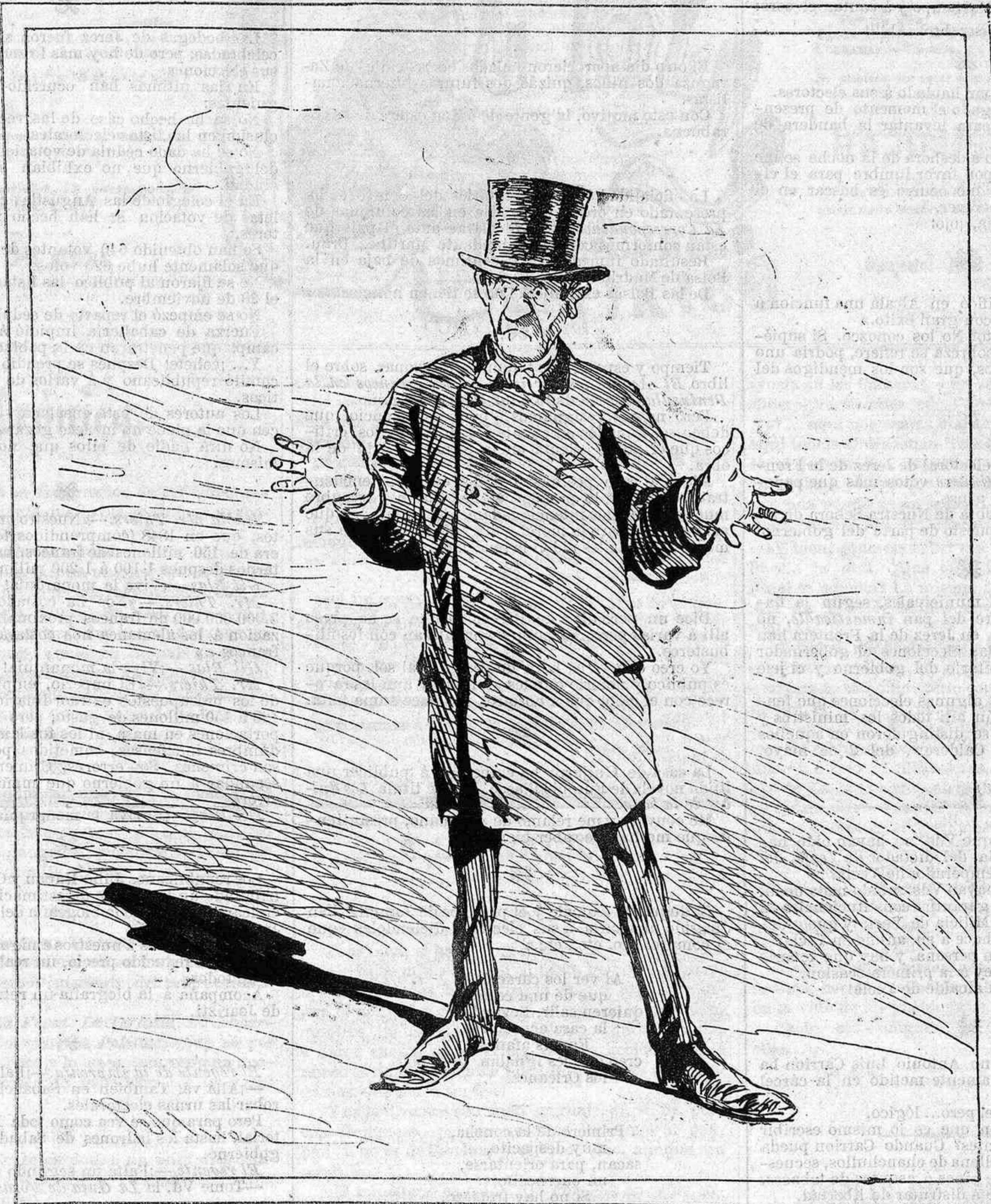
—Pues señor, no sé á qué altura piensa remontarse este ministerio para caer.

zorrillistas, que creéis en las palabrotas de los lunes, en los denuestos de los miércoles, en los insultos de los viernes, y que no veis los brindis, los piropos, las miradas coquetonas que los viernes se cruzan en la mesa del rey que habeis elegido!