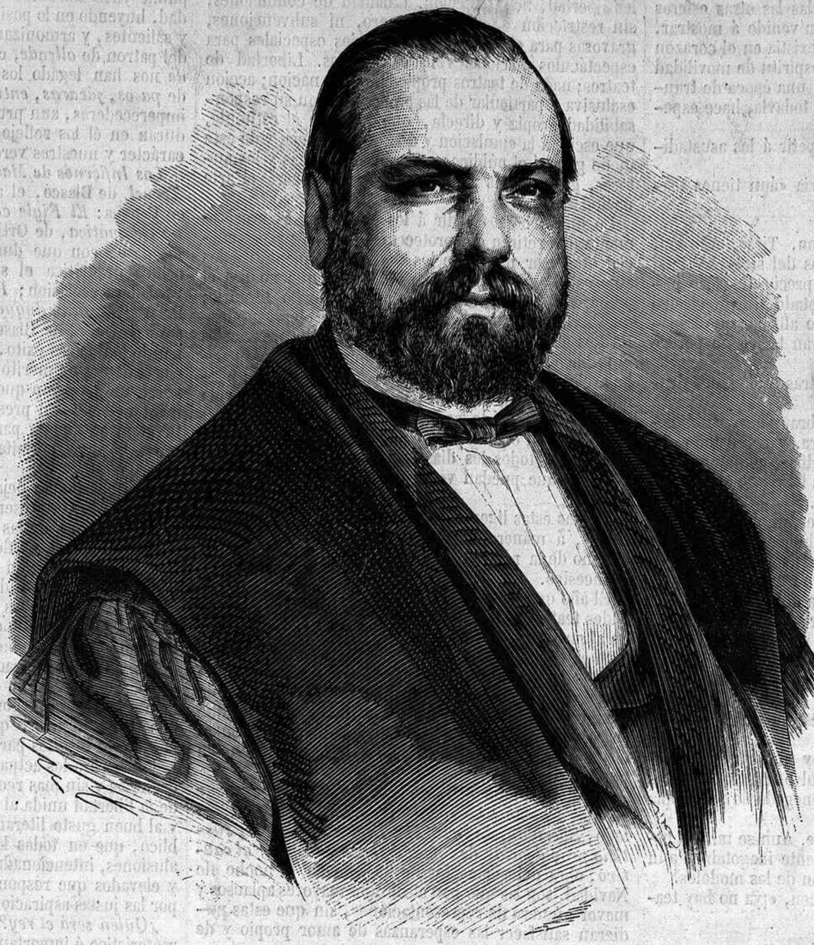
DON NICOLÁS MARÍA RIVERO.

Como orador parlamentario no fue menos notable que por las dotes de organizador de partido. Observador profundo de los hombres y de las cosas, elevado en sus apreciaciones, dotado de admirable intuición política, severo en las formas, poderoso en la argumentación y formidable en la polémica, sus discursos han producido siempre honda sensación en la cámara, y arrancado el aplauso y llevado la convicción al ánimo de sus mismos adversarios. No es de los diputados cuya voz resuena de continuo en los ámbitos de la asamblea de los legisladores. Escoge el tiempo, elige