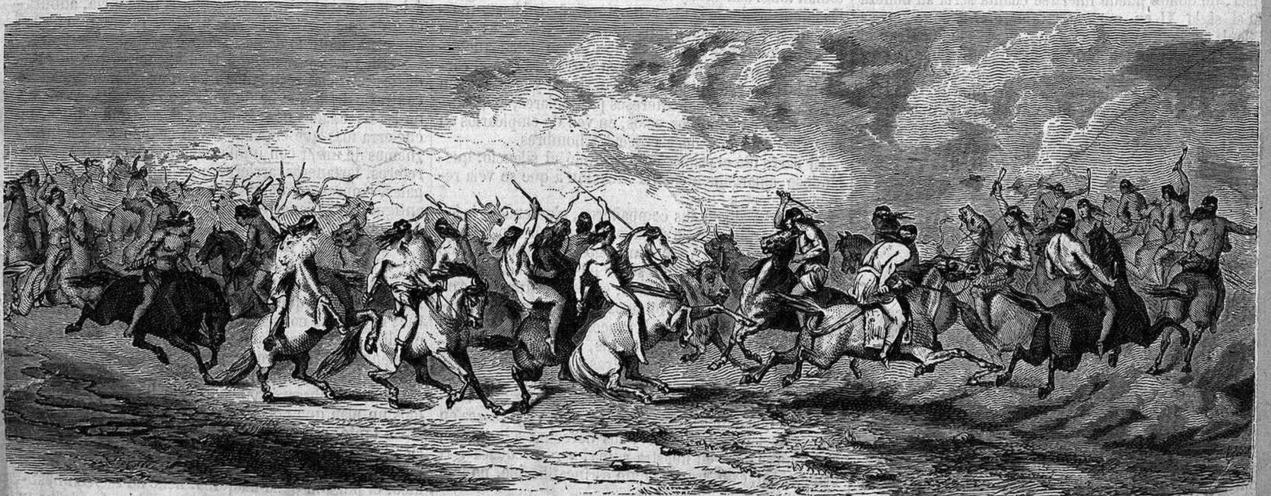
CORRIDA PROPICIATORIA DE LOS PATAGONES EN DERREDOR DE LOS ANIMALES DOMÉSTICOS.

El número de objetos espuestos, segun el catálogo que se vende