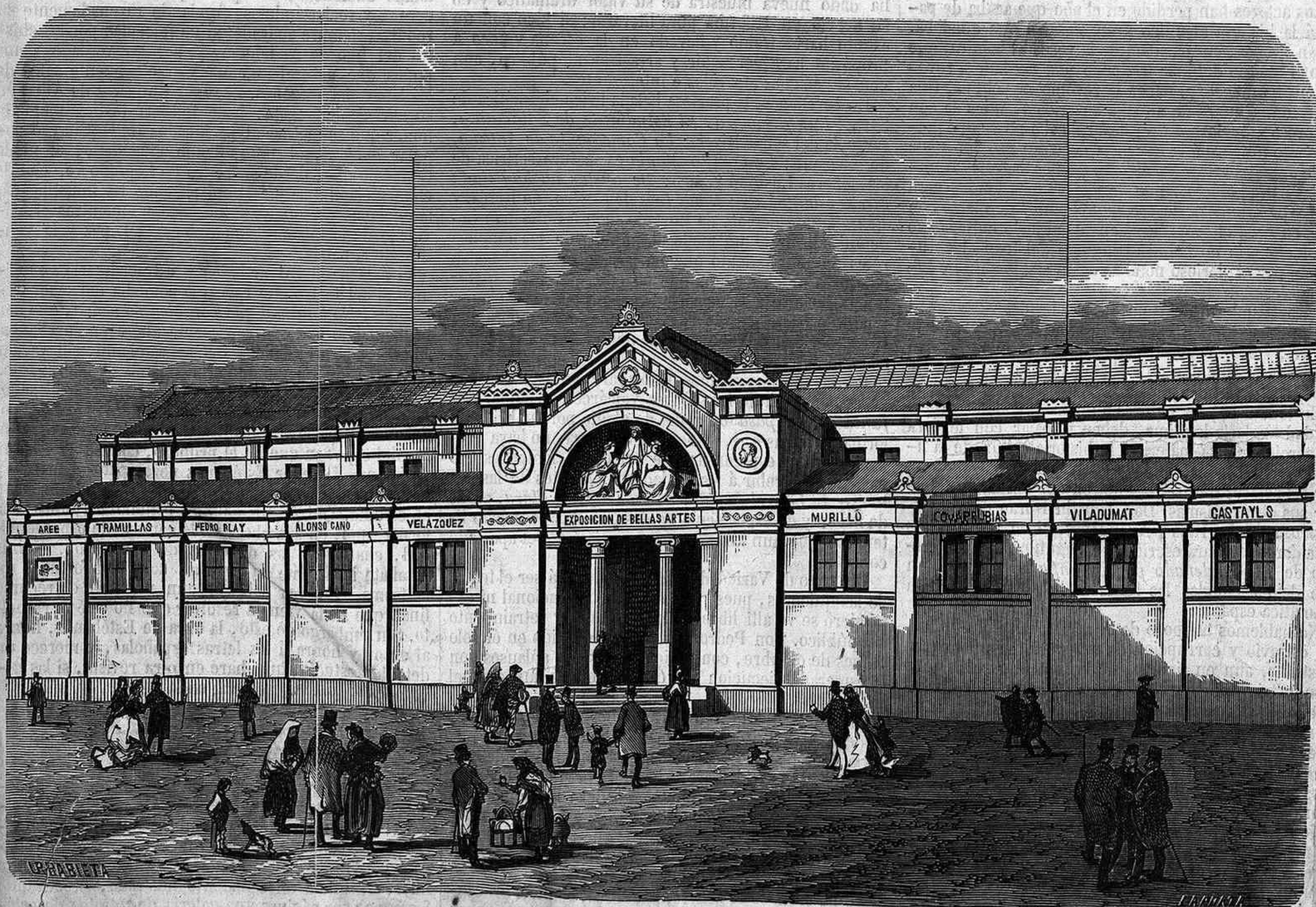
EXPOSICION DE BELLAS ARTES DE BARCELONA.