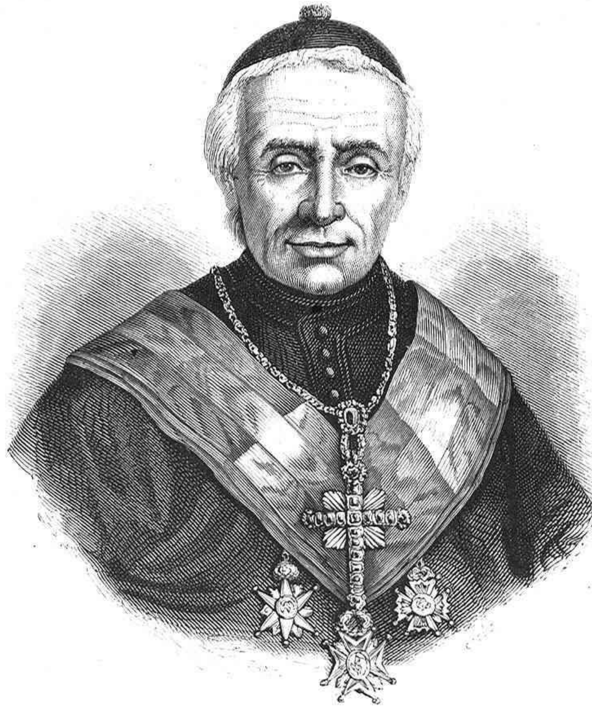
EL CARDENAL D. JUAN JOSE BONEL Y ORBE.

Los bailes, sin embargo, no han dejado de estar animados, y en el año actual ha habido en este punto una nove-