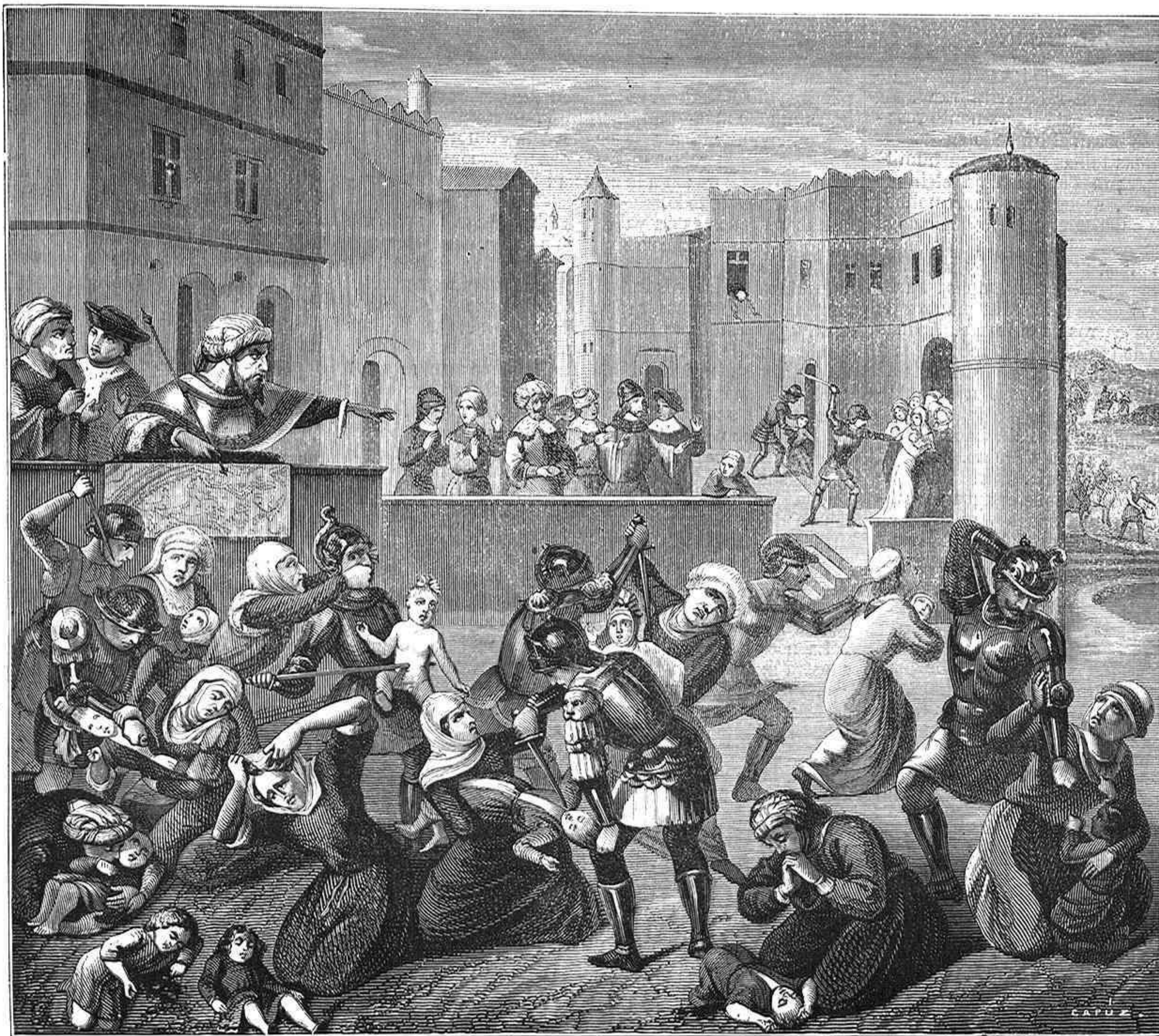
LOS SANTOS INOCENTES. (TABLA DEL SIGLO XV).

Acaso nos ciegue la afición á esas obras de la época espiritualista que llamamos edad media; pero de nosotros sabemos decir que la contemplación del notable cuadro reproducido, nos causó singularísimo embeleso. Es preciso verle para admirar toda la viveza, transparencia, armonía y perfecta conservación de su colorido, aquel baño especial que ofrece, no parecido al de ninguna otra pintura análoga, y que si algún estilo semeja es el moderno purista. Tocante á la composición, el traslado que presentamos da de ella una idea muy cumplida. Cuando, excepto en Italia, todos los pintores de Europa lidiaban aun con formas rehacias, efectos duros, difíciles perspectivas, claro-oscuro indeciso, aquí tenemos formas graciosas, escorzos oportunos, buen agrupado, movimiento hasta de sobra, contrastes, relieve, viveza, expresión, imaginación, sentimiento, verdad y aun poesía, por ejemplo, esa madre que chupa las heridas de su tierno vástago; esa mujer desesperada que se arroja de una ventana para salvar al hijito de su corazón. Si no fuera por los