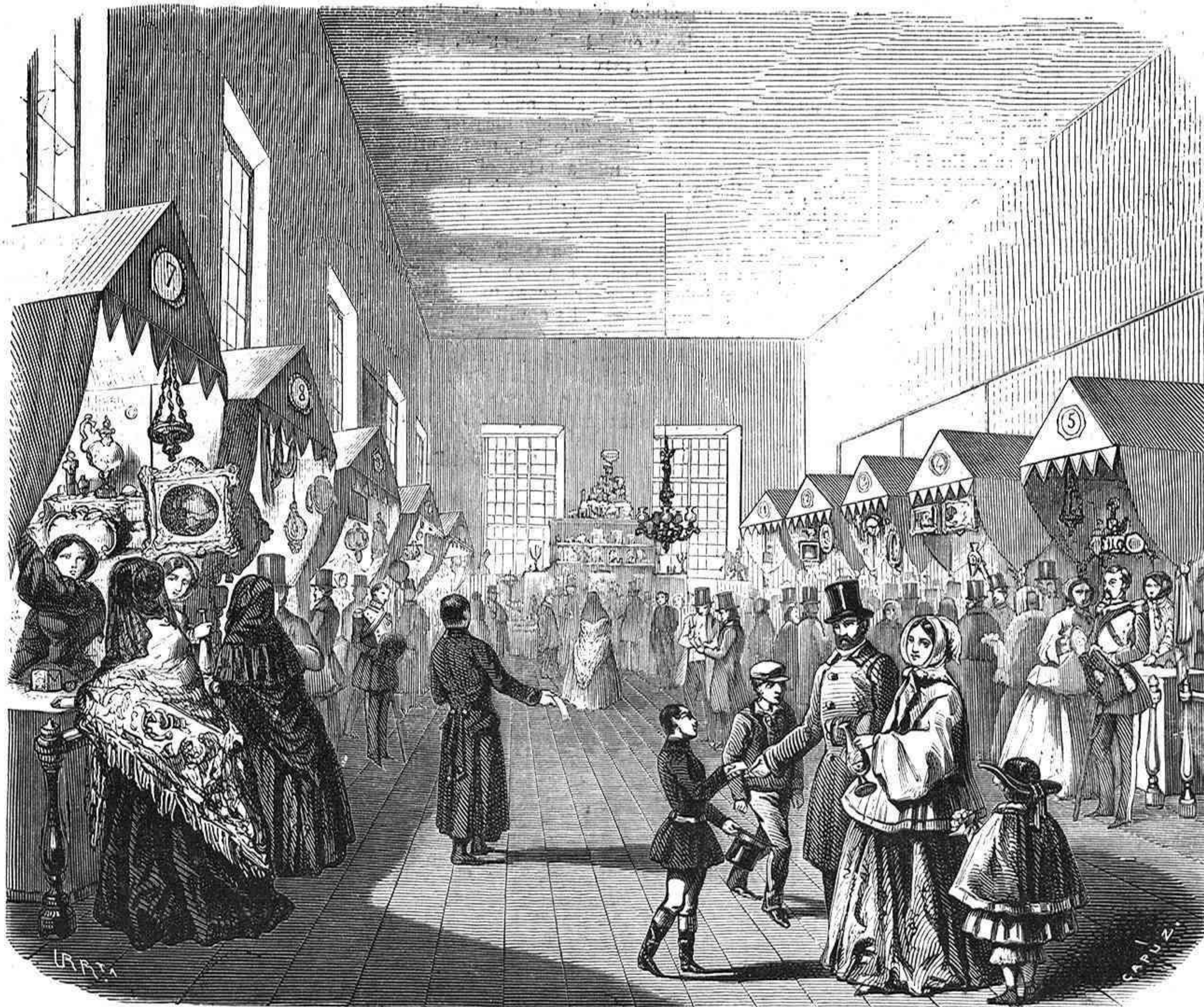
VENTA Y RIFA A BENEFICIO DE LA INCLUSA.

MADRID: IMPRENTA DE GASPARY ROIG, EDITORES, PRINCIPAL, 4.