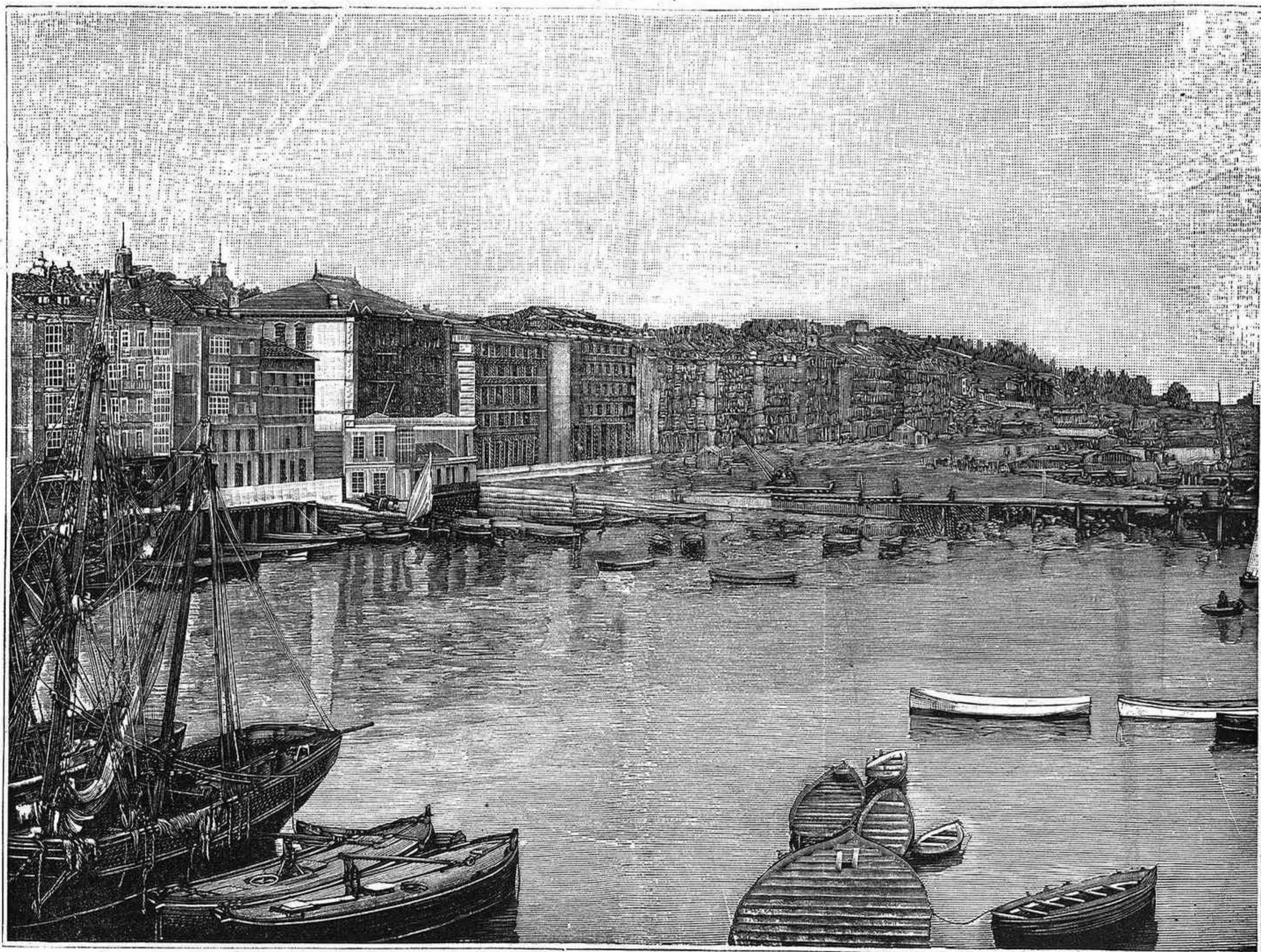
LOS MUELLES DE SANTANDER

El hombre está obligado á prestar su concurso á la obra común de la humanidad, y ¡ay de él si, guiado por un falso egoísmo, se aísla! Sin él sentirlo, le falta-