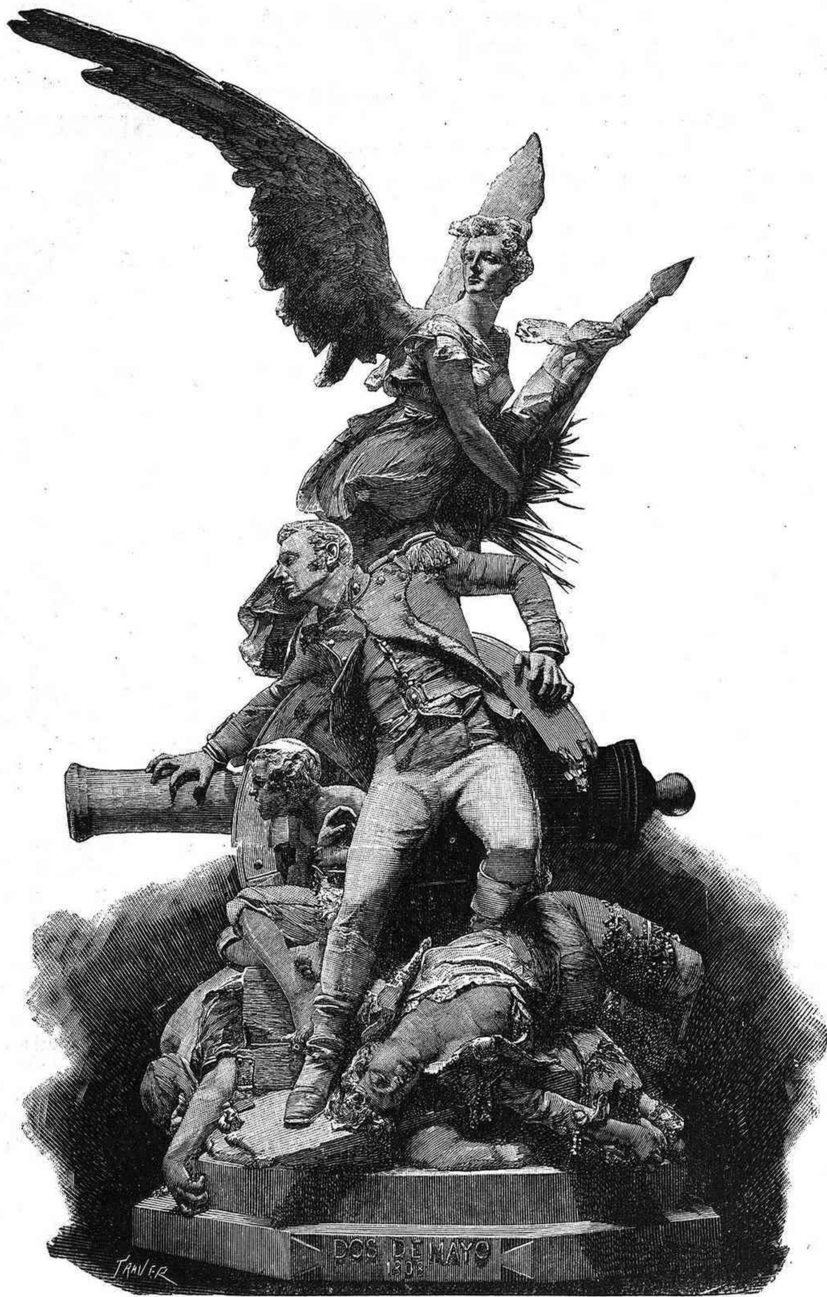
EL DOS DE MAYO (ESULTURA DE MARINAS)