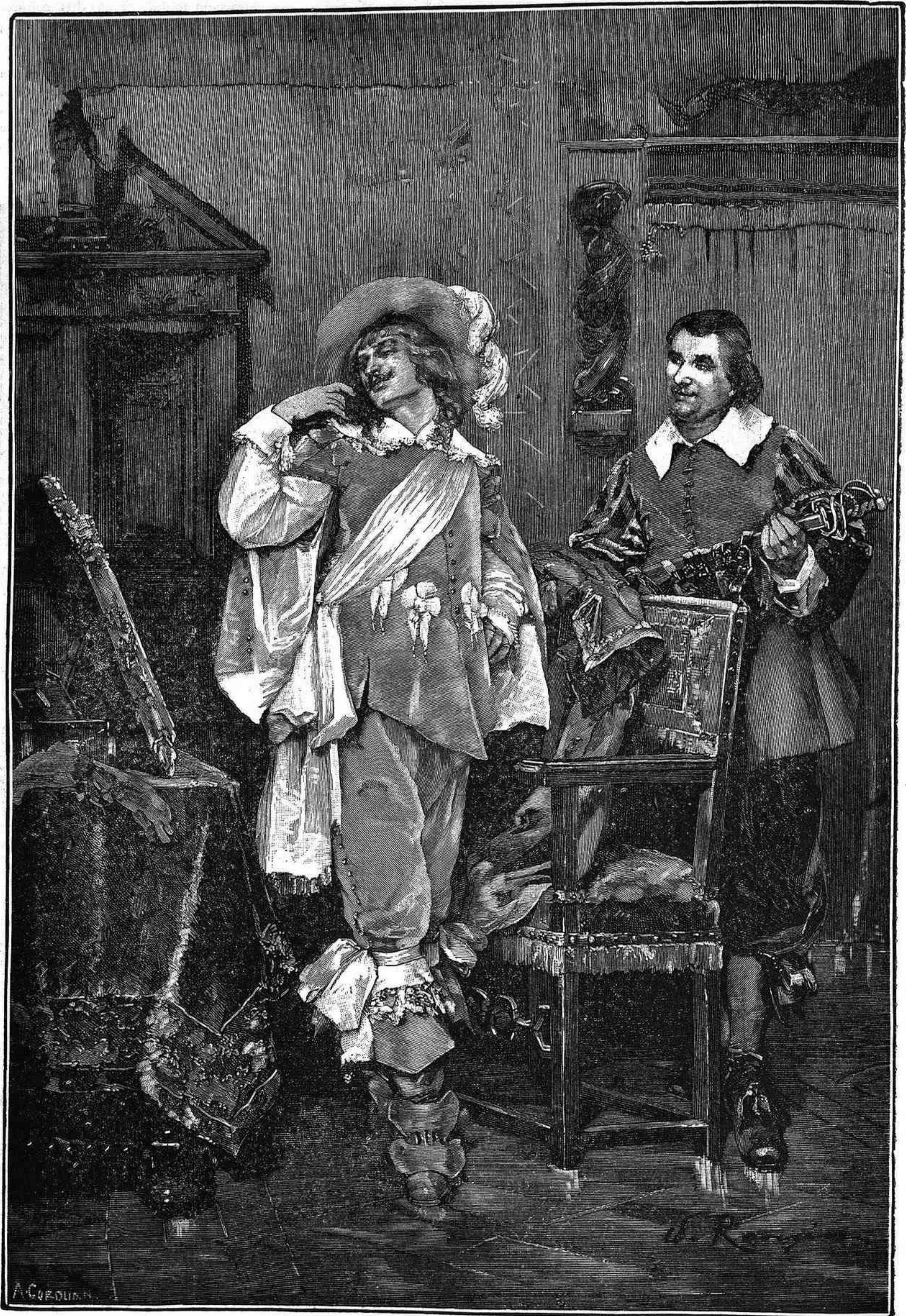
PRESUNCIÓN Y GENTILEZA