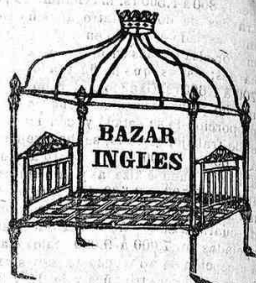
Ambrosio de Morales, frente á la cuesta de Lujan.

Toldos. Se hacen nuevos, se componen y colocan, sea cualquiera la irregularidad de los patios. Calle del Duque de la Victoria, antes de los Huevos, núm. 5, darán razón.