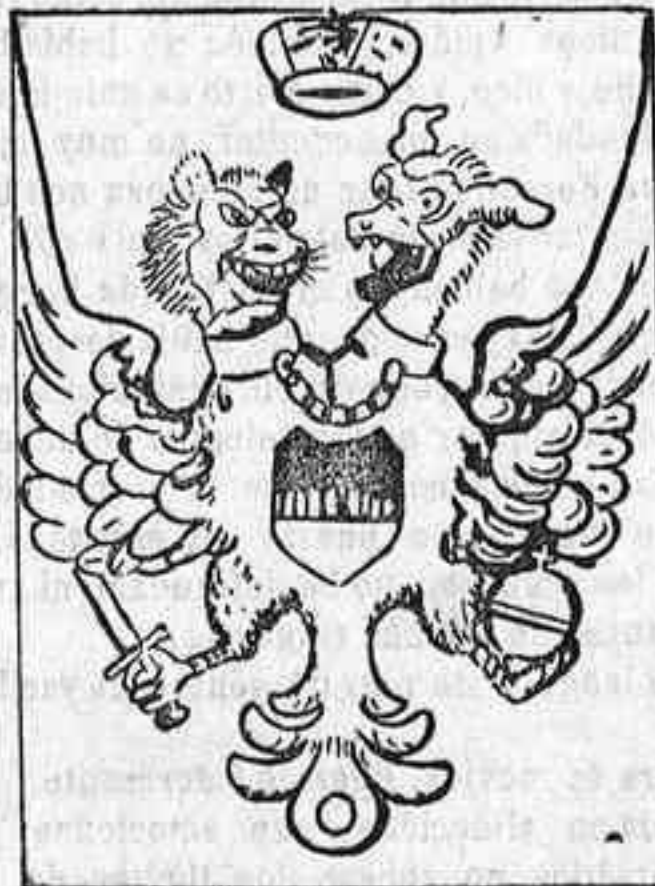
Armonías austro húngaras

Tal es el cariño que se profesan las dos mitades del imperio austro-húngaro, que ni aun en el escudo pueden vivir en paz. (De La Ilustración Italiana.)