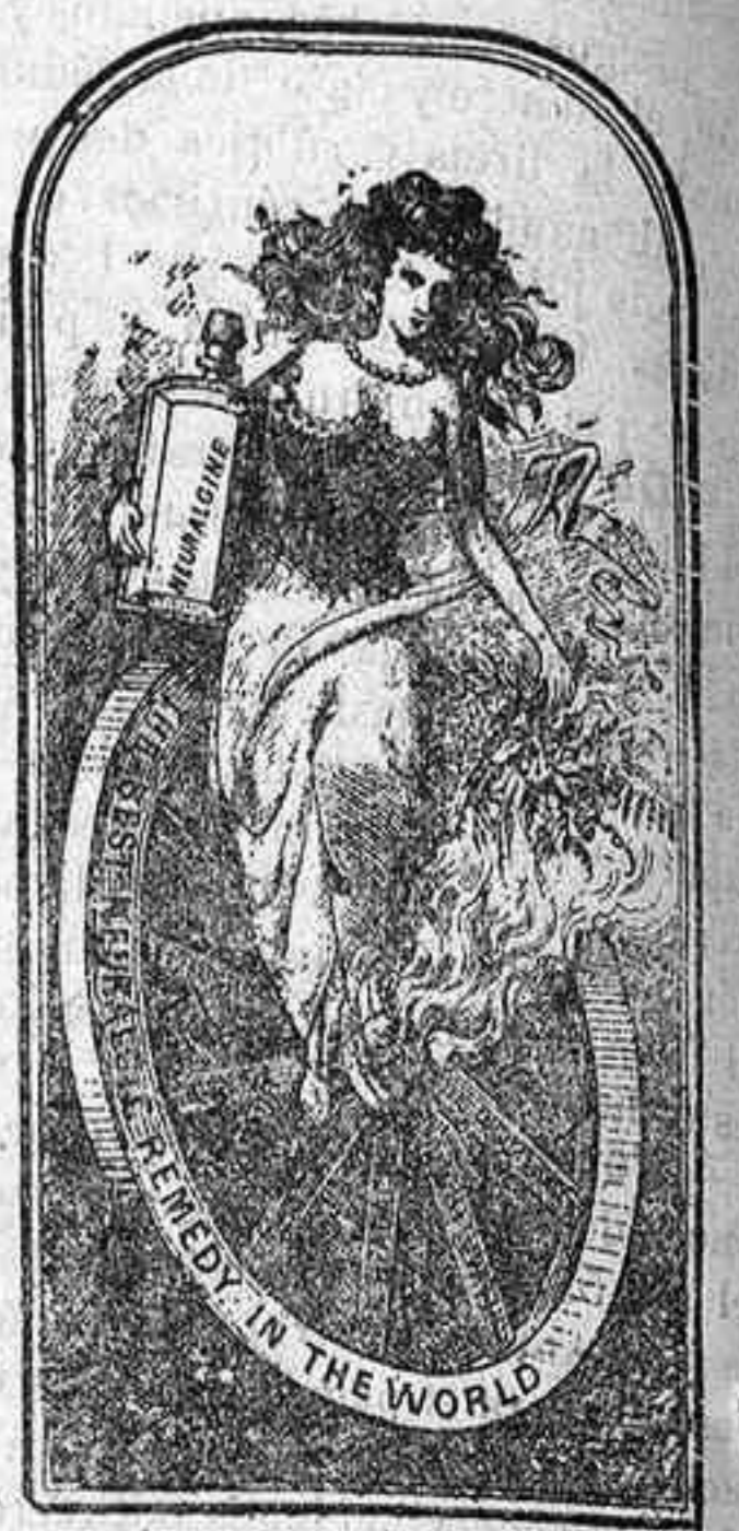
BÁLSAMO DE NEURALGINE

Lo venden los Farmacéuticos. Deséchese toda imitación barata e inútil.