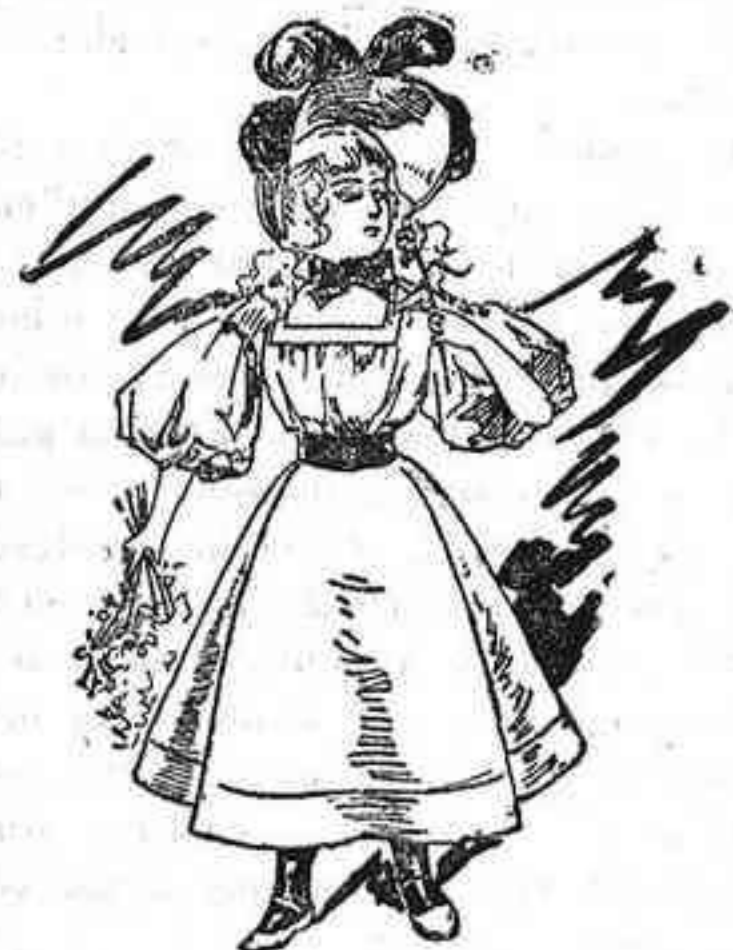
Traje para niña de doce años.

He aquí una gran ocasión de que nuestras amables lectoras demuestren, una vez más, su indudable buen gusto.