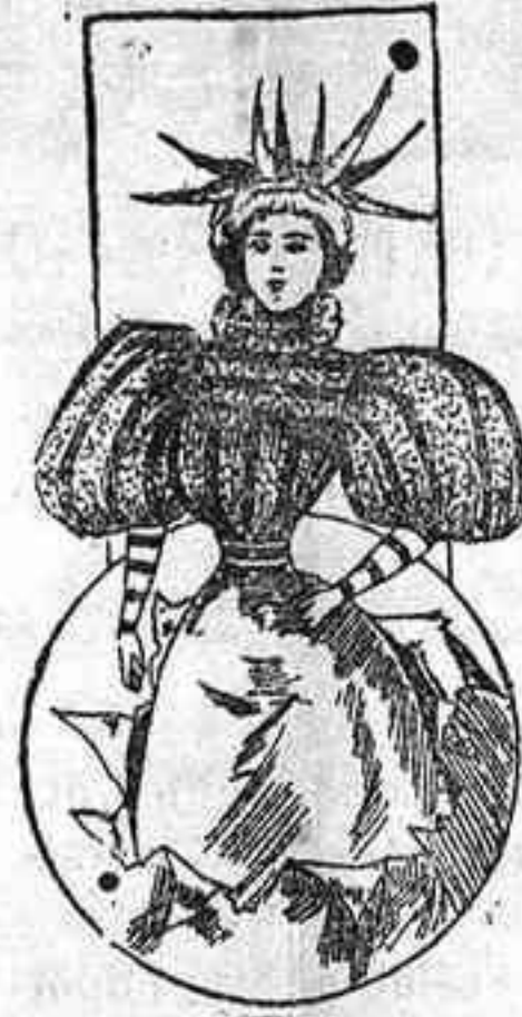
Traje para visita.

el hombro; falda acampanada con un pespunte en el bajo.