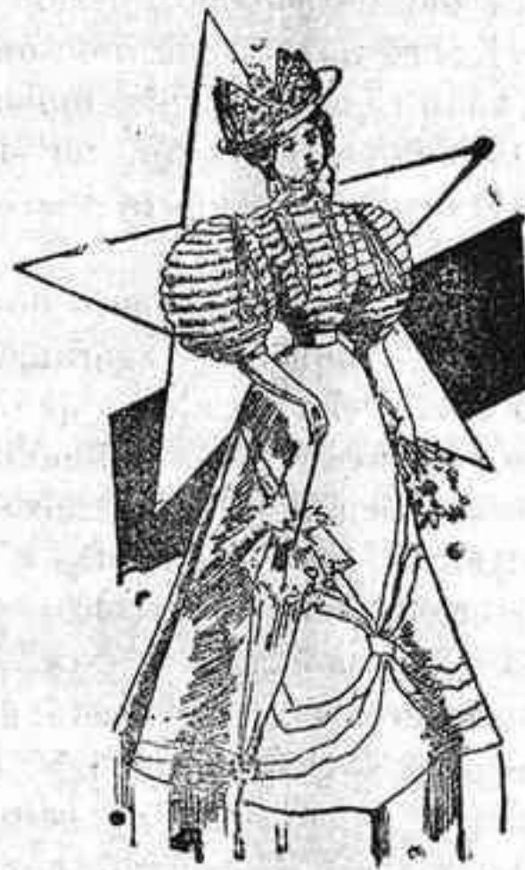
Traje de paseo.

Cuerpo de encaje, forma blusa, flojo en el delantero, con tiras de cinta de terciopelo á igual distancia, y formando piezas, otras saliendo de estas y juntándose en el talle con un cinturón del mismo género; cuello alto con una lazada de encaje; mangas cortas, con puños, forma globo y terciopelos en las mismas; falda de seda, forma campana.