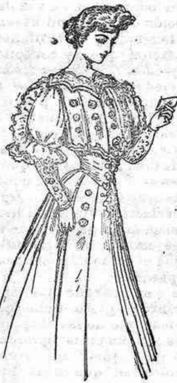
Vistosísimo traje para recibir.

Cuello aplanado, con desecote, formando diversas angulaciones de encaje, que se prolonga en distintas series de bullones rodeando totalmente las mangas. Puño largo, con tres botones. Cuatro tiras en el pecho, también con series de tres botones cada una de ellas. Cinturón de seda, con botones igualmente, así como las principales tablas de la falda.