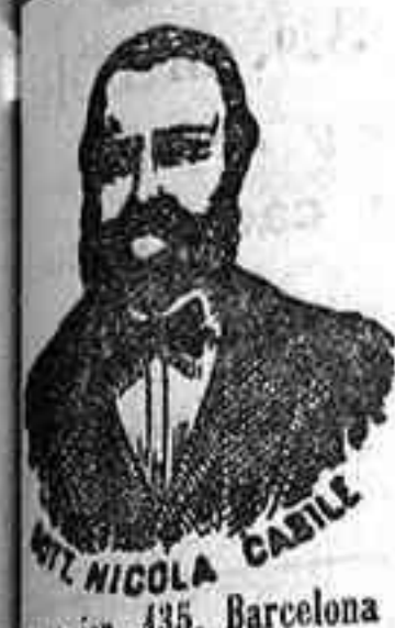
Dr. NICOLA CASILE Inventor de los renombrados medicamentos

han logrado que el Doctor Casile descubriera los mi- lagrosos medicamentos que curan infaliblemente la tisis en cualquiera de sus periodos y todas las enfer- medades del estómago. A la más pequeña manifesta- ción de un resfriado, tos, catarro, bronquitis, gripe, as- ma (sufocación), expectoración y de cualquier enfermedad del pecho, tomar inmediatamente las Perlas Casile, que no sólo curan infaliblemente estas enfermedades, sino que se tendrá la completa seguridad de no contraer otras mucho más graves. Siguiendo este método se po- drá decir no más tisis. Si por descuido no se hubiera seguido este tratamiento y por desgracia cualquier persona se encontrara atacada de tisis, no tiene que apurar, porque gracias á los constantes estudios he- mos podido encontrar los renombrados Confitos Casile, que asociados á las Perlas, combaten con eficacia la ti- sis en cualquiera de sus periodos.