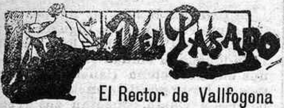
El Rector de Vallfogona

Por la mañana permitieron los japoneses que nuestra chalana siguiese su curso, y la mañana del 27 del mismo mes llegáramos buenos y sanos á Futschou (alejado 35 verstas de Chéfu). Allí nuestro chino alquiló un vehículo, haciéndome pasar á mí por francés y á mi compañero por inglés; la misma noche llegáramos á Chéfu, desde donde nos fué posible seguir nuestro viaje.