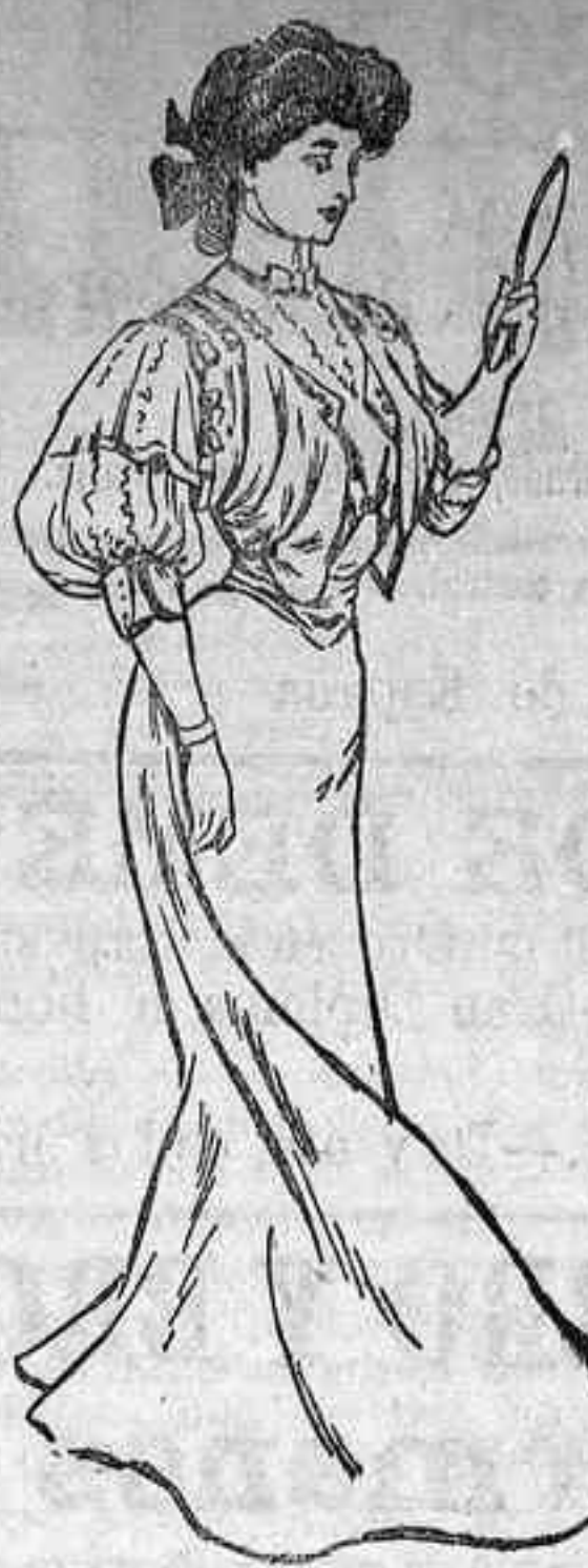
Las Píldoras Pink se hallan de venta en todas las farmacias al precio de 4 pesetas la caja ó 21 pesetas las 6 cajas.