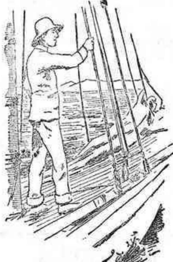
S. M. el Rey en el balandro «Dios salve á la Reina», momentos antes de empezar la regata.