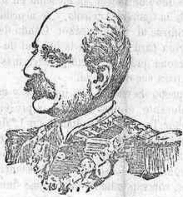
General Primo de Rivera, nuevo Ministro de la Guerra.